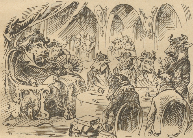
Die Rathssitzung der gesammten Büffelschaft.