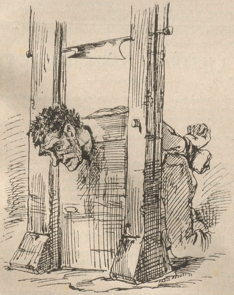
„Ein Hauptabschnitt aus dem Leben eines Verbrechers.“

der einzelnen Abschnitte und Capitel in Romanen und Novellen sind oft inhaltreicher als das ganze Buch. Falsch aber ist es gewiß, wenn man das Capitel über die Jugendzeit eines Märders wie folgt überschreibt: