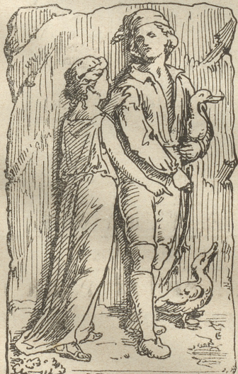
(Auflösung in nächster Nummer.)