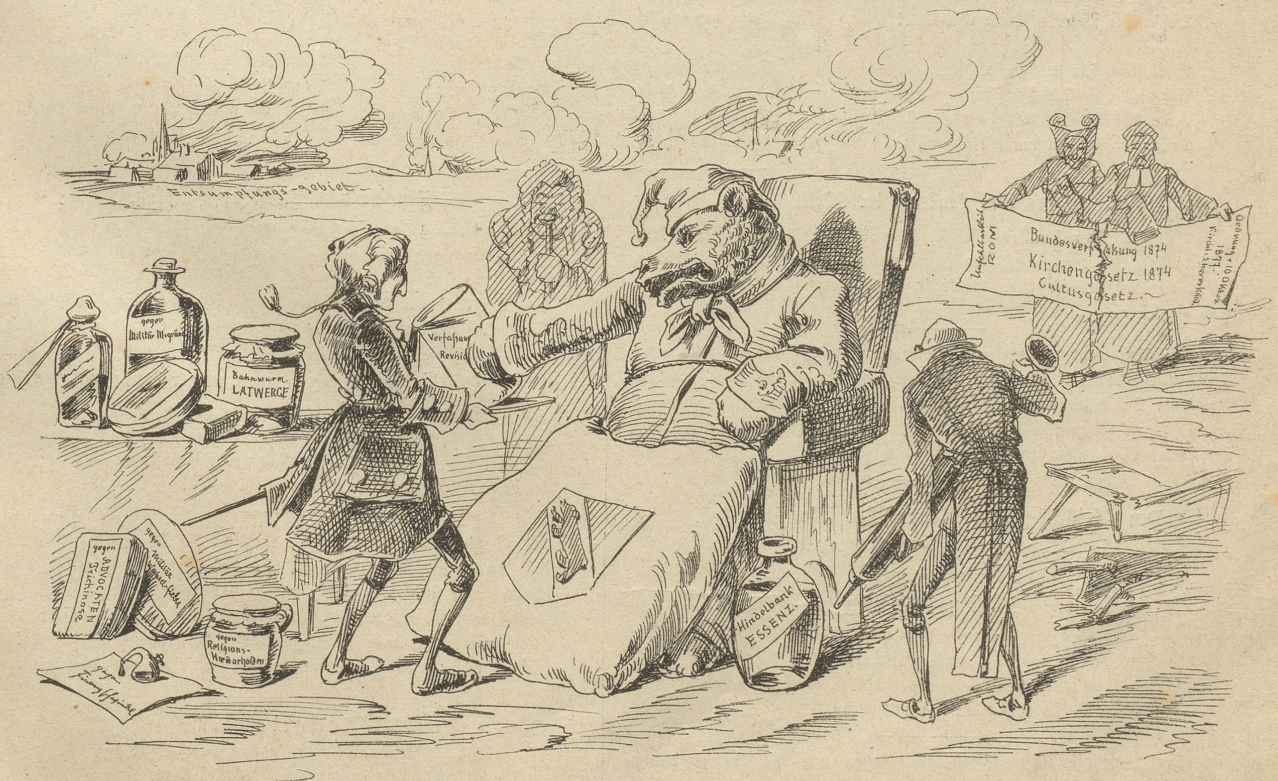
Der böse Auk im Krankenzimmer.

Alle Postämter und Buchhandlungen nehmen Bestellungen entgegen; franko für die Schweiz: für 6 Monate Fr. 5, für 12 Monate Fr. 10; für das übrige Europa, für Aegypten und die Vereinigten Staaten Nordamerika's per 6 Monate Fr. 7, für 12 Monate Fr. 13. 50; für Südamerika, Asien und Australien per 6 Monate Fr. 12, per 12 Monate Fr. 22. Einzelne Nummern 25 Cts.