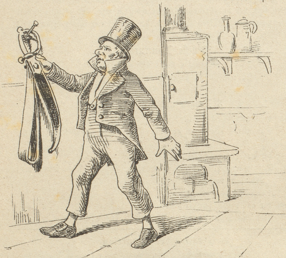
1) Wenn ihn eine sich're Hand Herablangt von der dunkeln Wand,