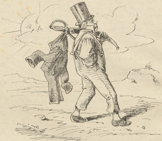
2) So läßt er schon beim ersten Gang, Wenn heiß es ist, sich praktisch an.