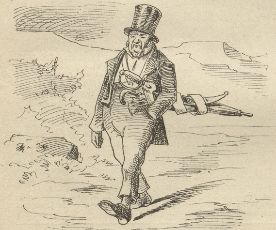
3) Und bei schön Wetter da verträgt Der Schirm sich herrlich mit dem Schwert.