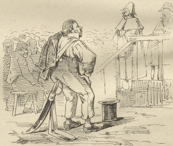
4) Und bei der Landsgemeinde dann Dient er bei langer Red' dem Mann.