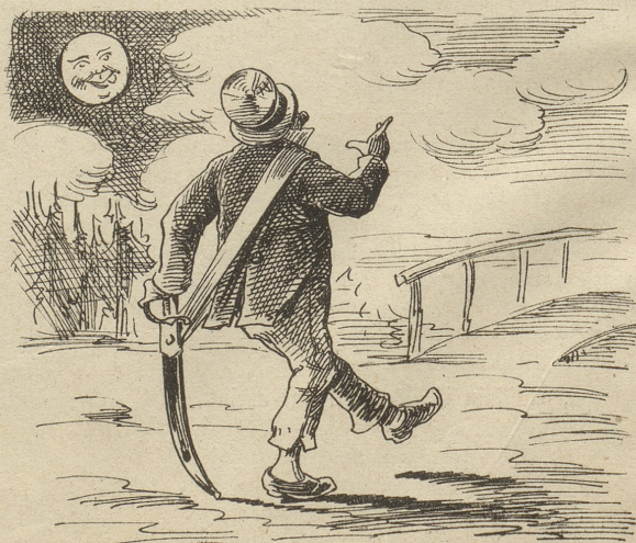
6) Und zwar beim Heimgang wenig nicht Macht unser Mond ein schief Gesicht.