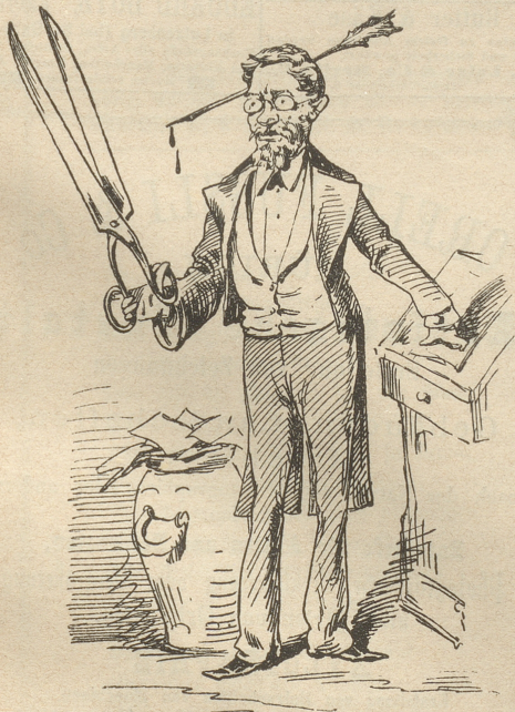
Ein schneidiger Redaktor!

Für eine täglich erscheinende politisch-religiös-demokratisch-liberal-konservativ-ultramontane Zeitung wird gesucht: