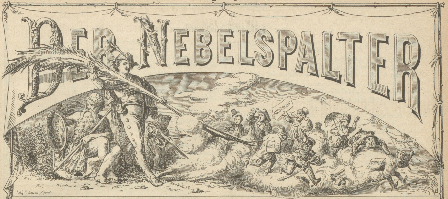
Lith. G. Knusli, Zürich.