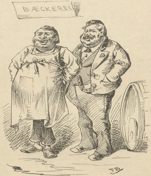
Bäcker und Metzger lachen sich den Buckel voll über die Gesundheitskommission, weil man ihre Fälschungen — keine Fälschungen sind.