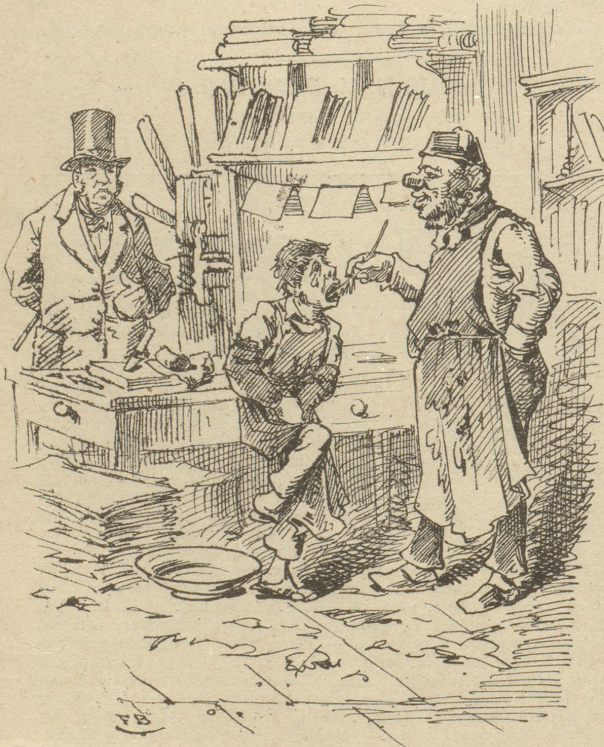
„Sehen Sie, lieber Herr, das ist für mich als Buchbinder eine wichtige Erfindung; nun habe ich wenigstens eine billige Kleisterfabrik. Der Junge erhält eine Wurst und dann muß er dafür — Kleister von sich geben!“