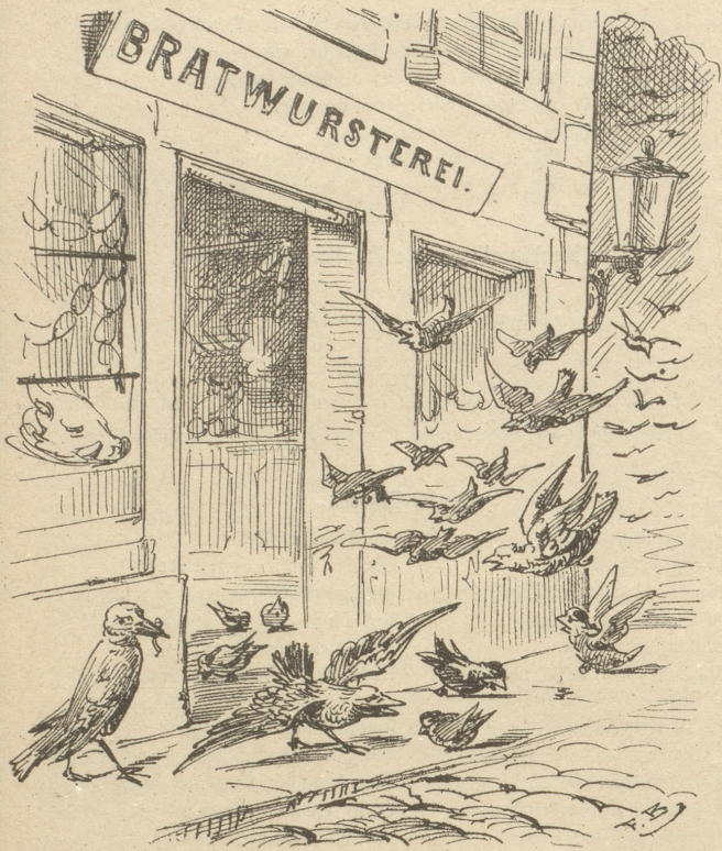
Der kommende Winter wird unsern gefiederten Freunden nicht mehr so hart vorkommen als sonst, denn nun finden sie wenigstens genug Mehlwürme.