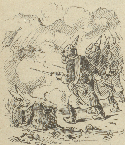
Im Orient auch großes Treiben, Die Hasen meist verschonet bleiben.