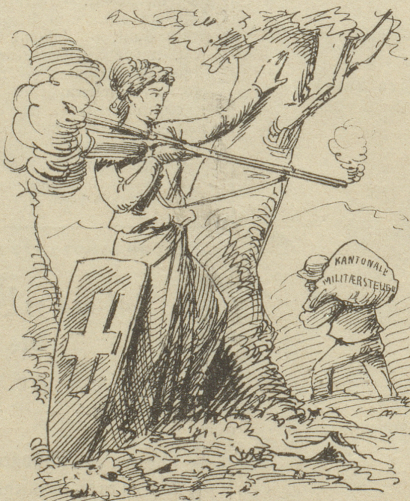
Auf Anstand ging um Geld sie aus, Doch weh, der Schuß geht hint' hinaus.