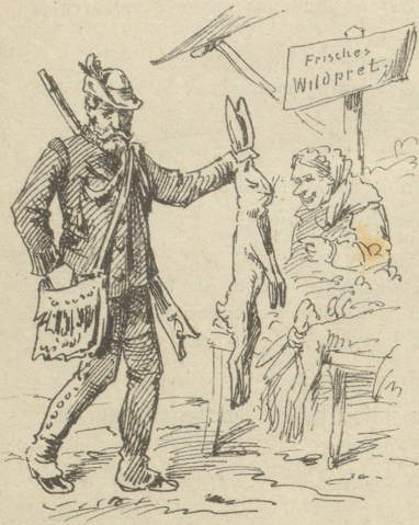
Die Jagd-Saison ist fest im Lauf, Der Jäger kauft die Hasen auf.