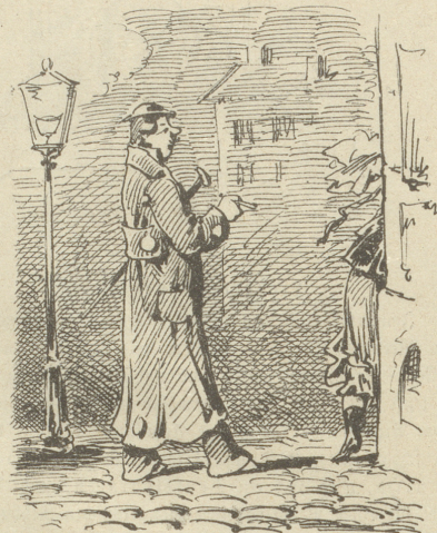
Und wenn die Nacht sich stellt ein, So sieht man and're Jäger fein.