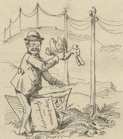
Auf Enten jagen ist ganz recht, Macht man die Sauce nur nicht schlecht.