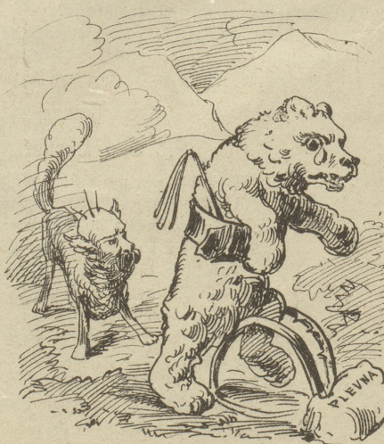
Der Fuchs, der kennt nicht Neu' und Bangen, Wird auch sein Freund, der Bär, gefangen.