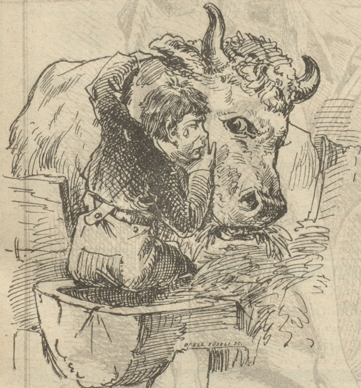
„Oh Lobe, hecht, jes häm'r fen Vater meh!“

In der Gemeinde B. lebte ein Vater mit seinem Sohne und beide liebten sich, wie sich Vater und Sohn nur lieben können. Friedlich und genüßlich bestellten sie mit ihrer Kuh, einem frommen und milchreichen Thier, ihr kleines Gut, das sie alle drei reichlich ernährte. Aber des Lebens ungetrübte Freude wird keinem Sterblichen zu Theil; der gute Vater erkrankte plötzlich und starb nach wenigen Tagen. Unendlich war der Schmerz des guten Sohnes, heiße Thränen rollten über seine Wangen und überwältigt von dem namenlosen Weh des Verlassenseins, ging er in den Stall, umhastete den guten „Mled“ und sprach mit klagender Stimme: