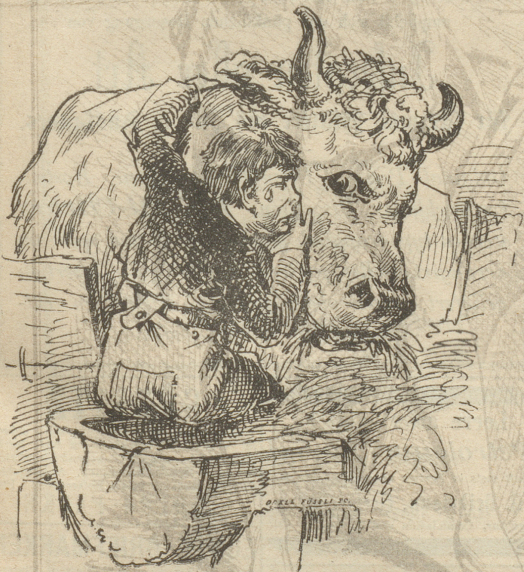
„Oh Lobe, hecht, jes häm'r fen Vater meh!“

In der Gemeinde B. lebte ein Vater mit seinem Sohne und beide liebten sich, wie sich Vater und Sohn nur lieben können. Friedlich und genüßlich bestellten sie mit ihrer Kuh, einem frommen und milchreichen Thier, ihr kleines Gut, das sie alle drei reichlich ernährte. Aber des Lebens ungetrübte Freude wird keinem Sterblichen zu Theil; der gute Vater erkrankte plötzlich und starb nach wenigen Tagen. Unendlich war der Schmerz des guten Sohnes, heiße Thränen rollten über seine Wangen und überwältigt von dem namenlosen Weh des Verlassenseins, ging er in den Stall, umhastete den guten „Mled“ und sprach mit klagender Stimme: