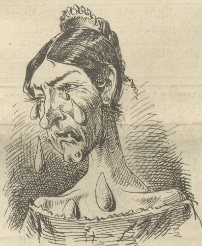
Sch weiß nicht, was soll es bedeuten, Daß ich so traurig bin.

Auflösung der „räthselhaften Inschrift“ in letzter Nummer: „Der Hof (Kind) ist eiser (immer), i seh ihn afe-ne-mol au do Wy suffe.“