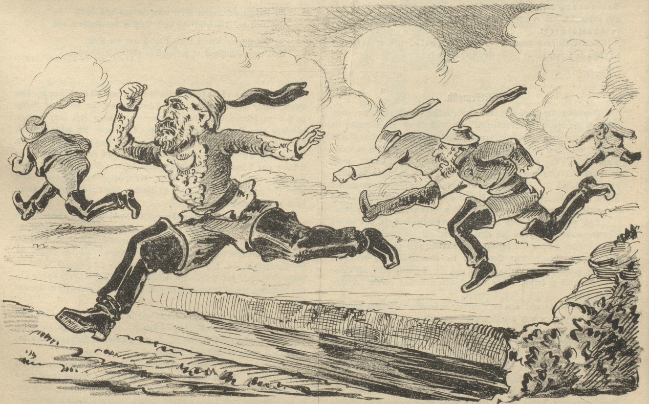
„Die Türken verfügten über sehr weittragende Kanonen.“