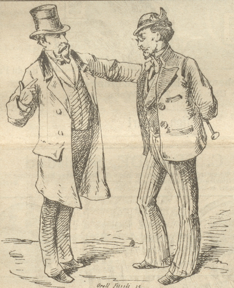
Orell Füssli sc.

Inserate im „Nebelspalter“ sind bei der großen Verbreitung des Blattes von um so sicherem Erfolg, als dieselben je eine ganze Woche aufliegen und beachtet werden. Inserataufträge sind einzusenden an die Annoncen-Expedition von Orell Füssli & Co., Marktgasse 14. Zürich. Preis pro Zeile 30 Rp.; bei Wiederholungen wird großer Rabatt bewilligt. Auskunft über alle in diesem Anzeiger erscheinenden Annoncen wird unentgeltlich erteilt.