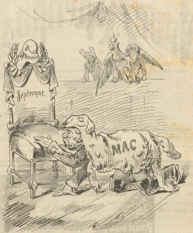
weiß ganz wohl, warum er zum Kreuz kroch, aber beinahe Alle täuschen sich über seine wahre Gestalt.