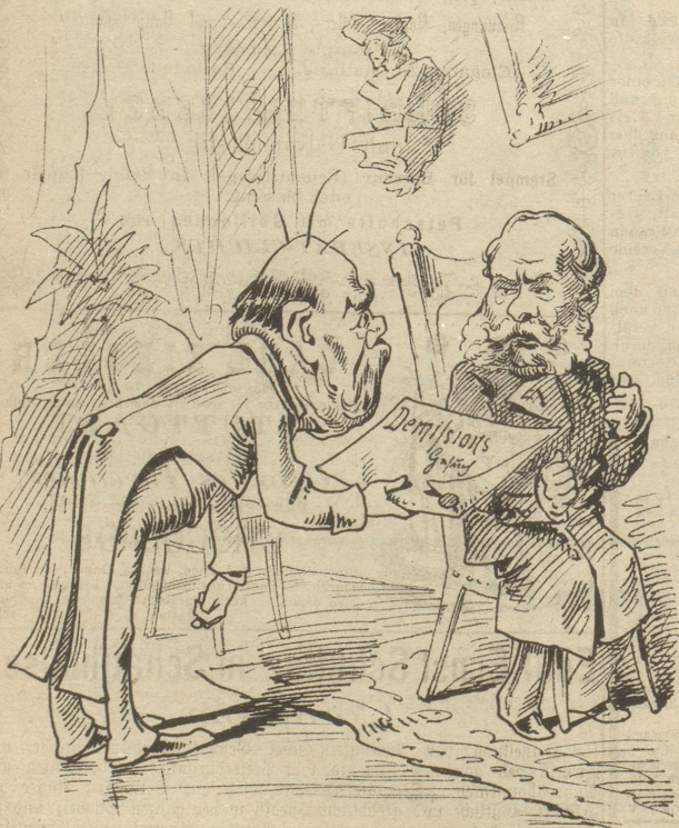
Wilhelm. Zu Weihnachten wieder Deine Demission? N'aus! Au die Karre in den Dreck gefahren, möchtest Du Dir drücken und mir vor'n Kest sitzen lassen. Bismard. Aber ich bin die Situation nicht mehr gewachsen. Wilhel n. Bismard! Bismard, dann gib mir erst meine Milliarden wieder.