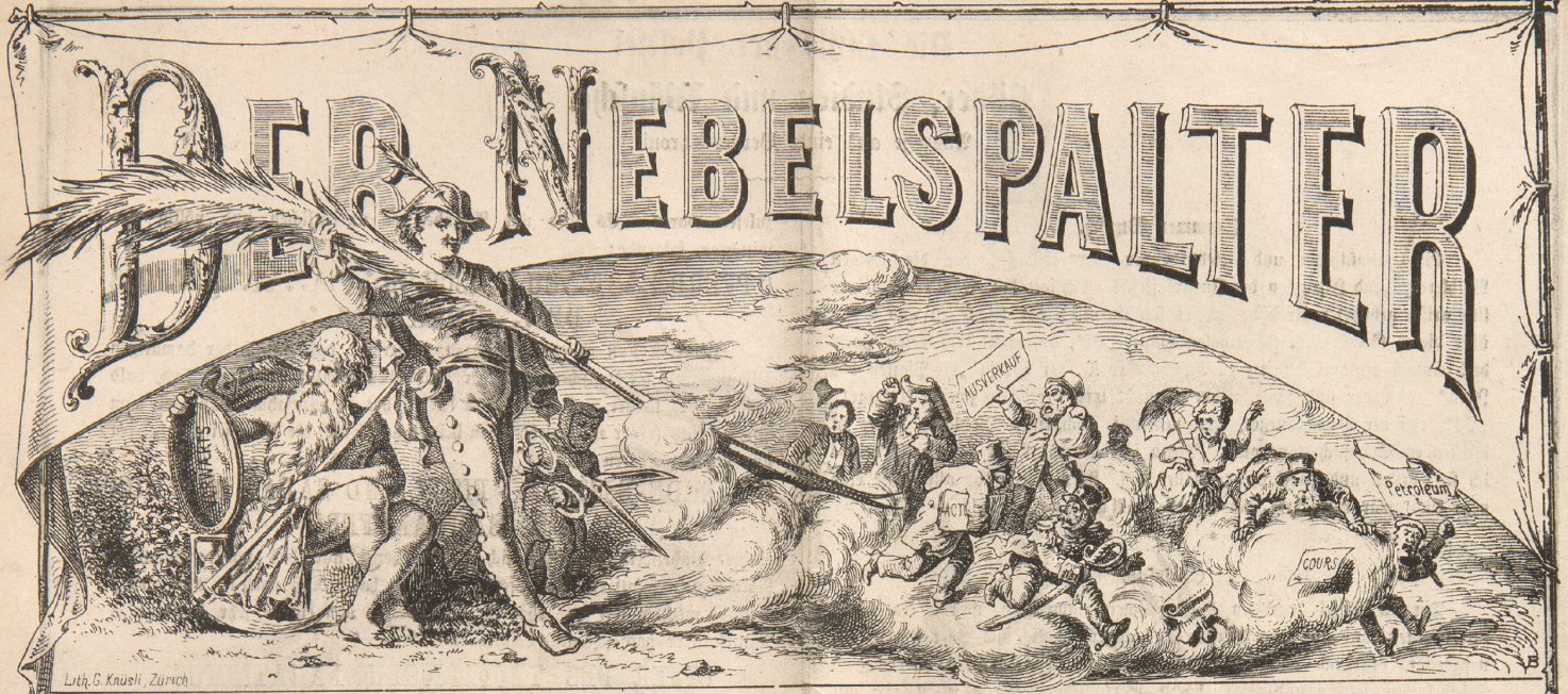
Lith. G. Knauli, Zürich.