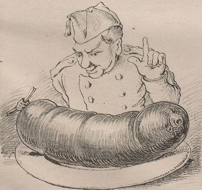
statt mit einem

wird in nächster Zeit von der Bundesversammlung wieder durchberathen werden und will man, so viel verlautet, ziemlich hohe Anzüge festhalten, damit auch den Milizen noch etwas am Spatz aufgebeßert werden kann. Die Vorschläge in dieser Beziehung sind ziemlich weitgehend; so wird man z. B. künftig die Wurst