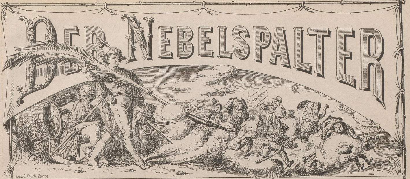
Lith. G. Knusi, Zürich.