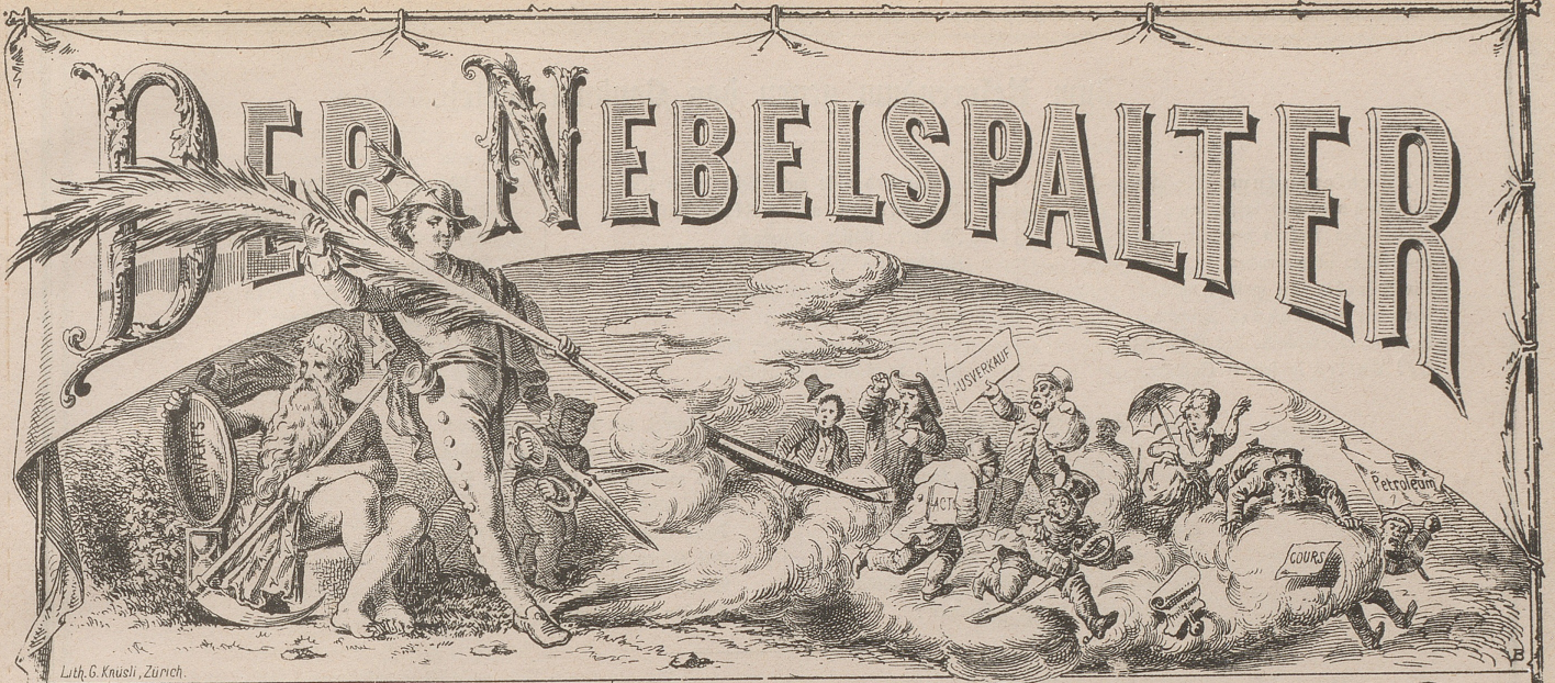
Lith. G. Knusi, Zürich.