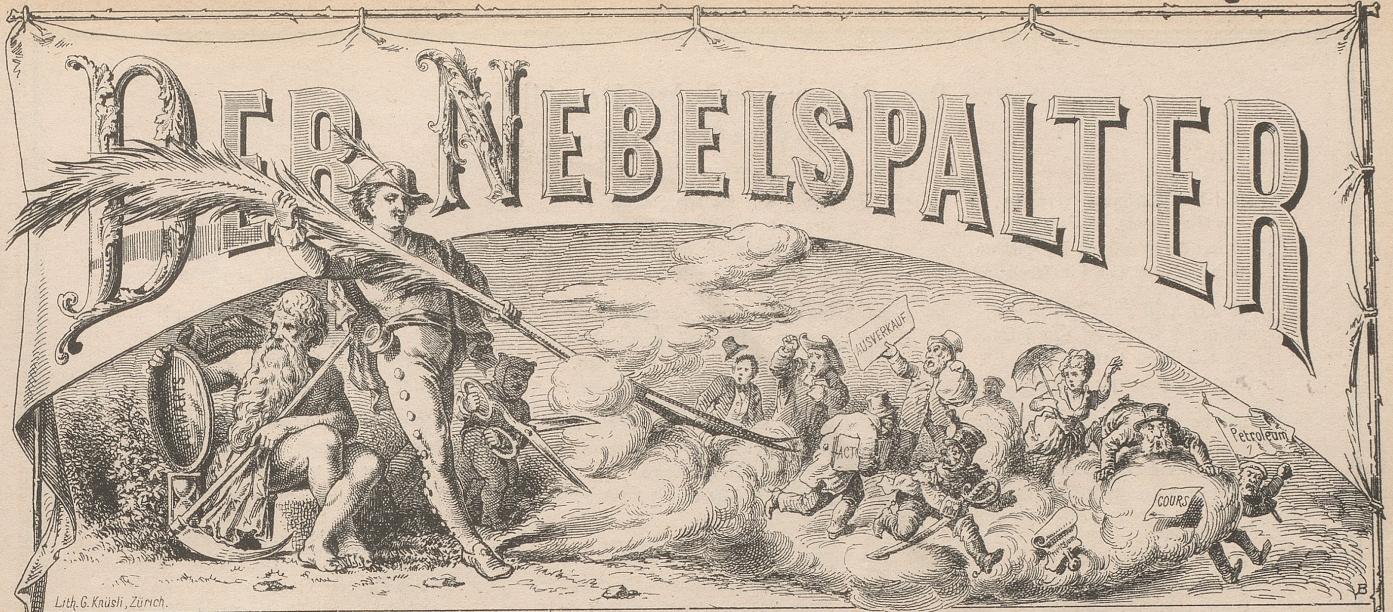
Lith. G. Krüssli, Zürich.