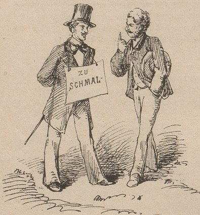
Stramm und flott, nur eine Linie zu schmal über die Weste! Ein Jahr Pause zur Erweiterung des Brustkastens.