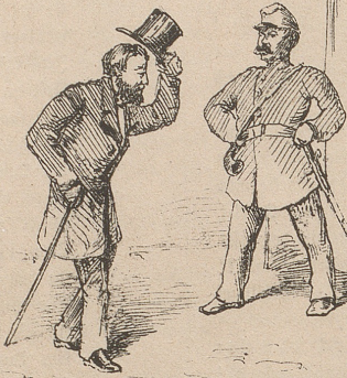
Der Niedergelassene der löblichen Stadt Zürich reist nun seit Annahme des Bürgerrechtsartikels viel selbstbewußter davon als vorher.