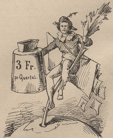
und der Rebelpalter sammelt inzwischen neue Anhänger, aber für sich — selber!