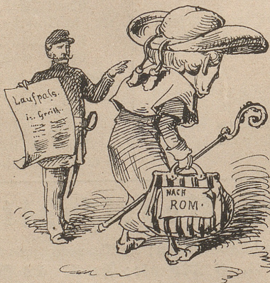
indessen wünschen die St. Galler sie hätten bald Gelegenheit, ihm ein Zeichen ihrer Anhänglichkeit zu geben.