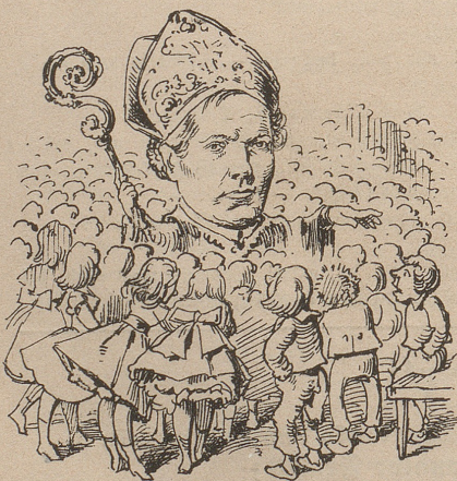
Bischof Greith in St. Gallen firmt unter starkem Zulauf der hoffnungsvollen Jugend: