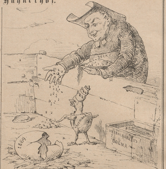
Aber beim daraus geschlüpften Küchlein gibt's: „Viel Geschrei und wenig Wolle!“