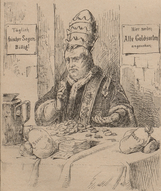
Da dieser alte Numismatiker alle möglichen Geldsorten pfennigweise und gegen Ablasszettel an sich ziehen will, nimmt der Rebelpalster gerne gegen gute Frankenvährung alle diejenigen als Abonnenten an, welche nichts von diesem Juden wissen wollen!