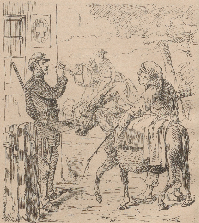
Sie, hören Sie, Ihre Regierung hat allerdings erlaubt Pferde in die Schweiz auszuführen; von Eiern aber war nicht die Rede, da haben wir — wie Sie auch — mehr als genug.