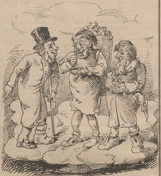
Diese drei Freiheitsmärtyrer haben im Himmel große Freude, daß sie endlich zur Anerkennung kommen und werden auf Injurie klagen bei Behauptung, sie seien Spitaler,