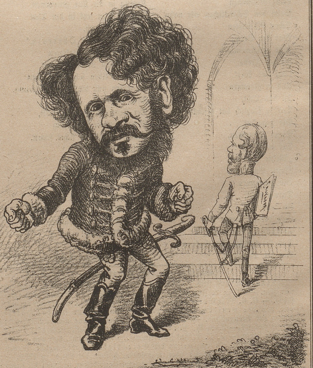
Minister Andrassy ist außer sich über den geschwätzigen Salvator und wünscht, er wäre Bier, statt Erzherzog.