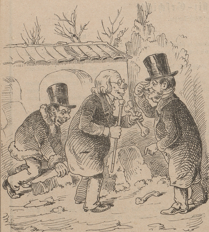
Ich seh' es ganz genau, das sind Aemtlernochen, das müssen die drei Freiheitsmärtyrer sein. Also Denkmal!!