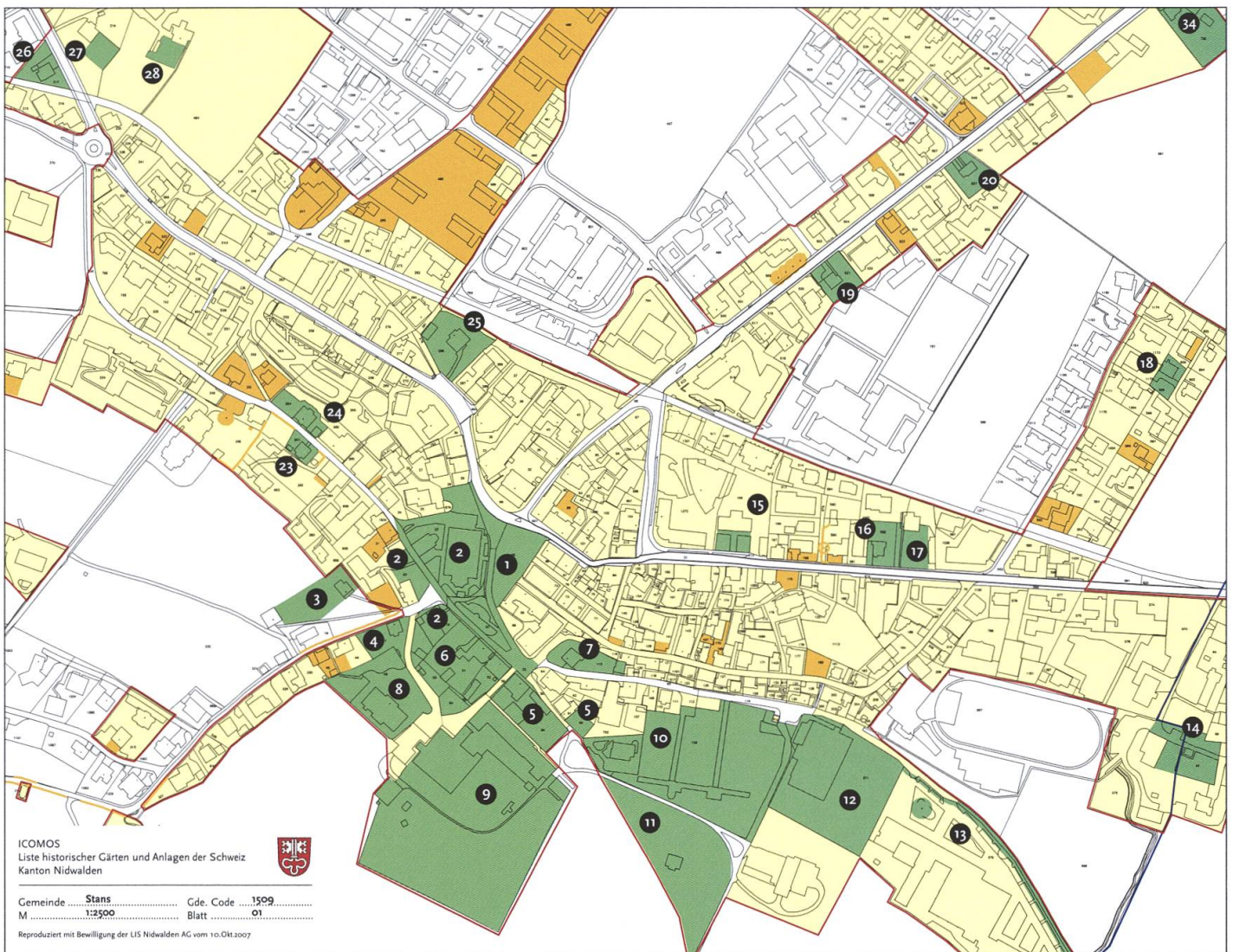
Abb. 3 Beispiel für ein Gemeindeblatt (Stans, Blatt 1)