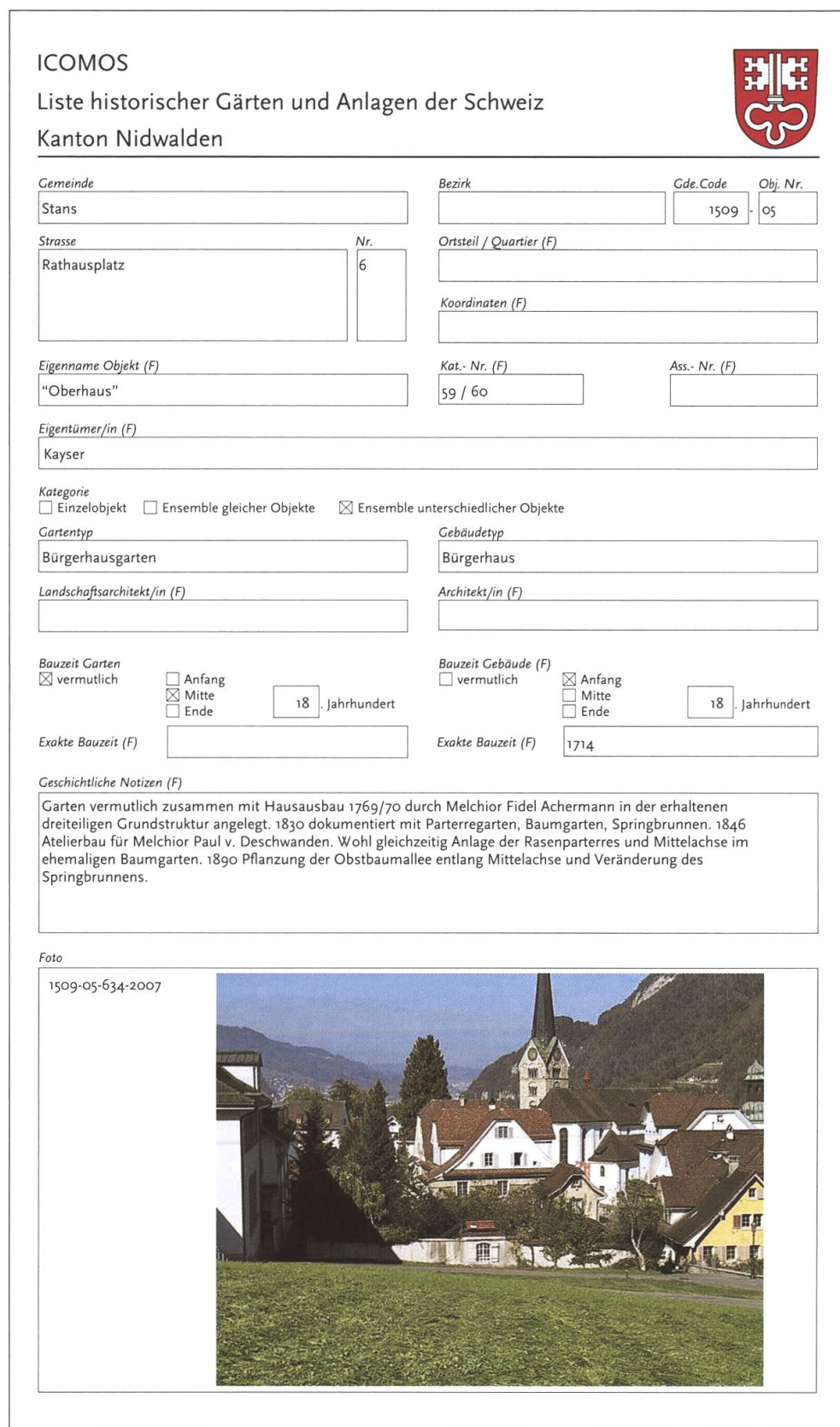
Abb. 4 Beispiel für ein aus- gefülltes Objektblatt.