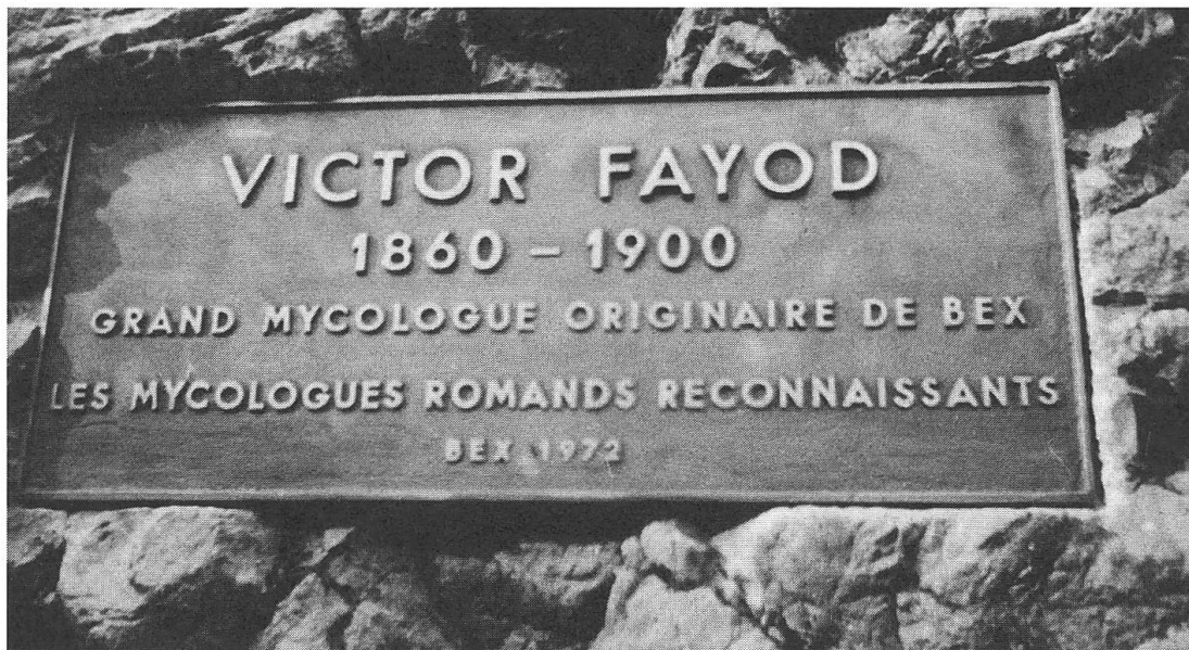
Fig. 1: Plaque commémorative placée sur un bloc erratique près de Bex.

Entre l'oeuvre de ces deux novateurs, la contribution de Victor Fayod n'est pas moindre.