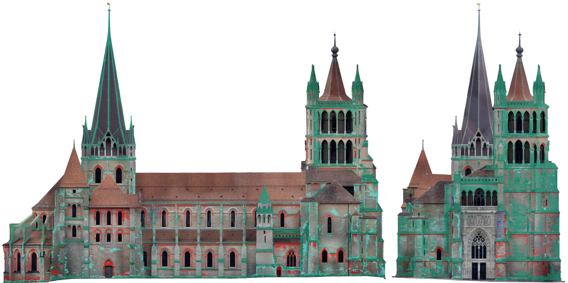
C3 Pathologies des façades nord et ouest : la façade ouest est particulièrement atteinte par les colonisations biologiques, à cause de la direction des vents provenant du nord-ouest.