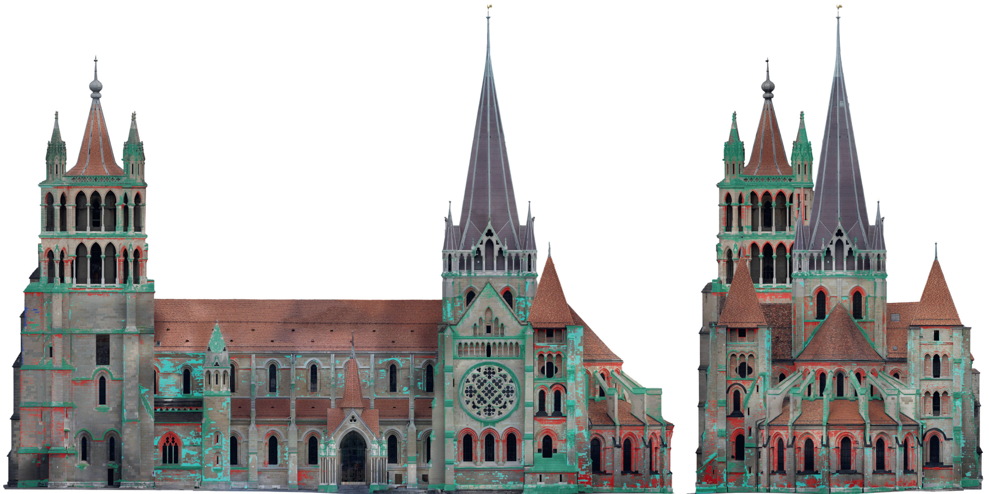
C2 Pathologies des façades sud et est : la façade est, plutôt abritée de la pluie, est impactée par la présence d'anciennes croûtes noires.