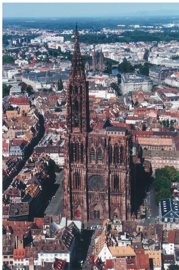
1 Cathédrale de Strasbourg.

Les relations entre l'État et la Fondation ont été longtemps fluctuantes. Les travaux pris en charge par l'État et par la Fondation de l'Œuvre Notre-Dame étaient conduits par deux architectes, un pour le compte de l'État et un pour la Fondation. En 1999, une convention-cadre instaurant une maîtrise d'œuvre unique sur la cathédrale est établie entre l'État et l'Œuvre Notre-Dame. Elle précise leur collaboration pour l'entretien et la restauration de la cathédrale. À partir de là, un seul architecte est désigné d'un commun accord entre les deux partenaires. Les projets de travaux sont validés par la Direction régionale des affaires culturelles, sous l'autorité de l'Architecte en Chef des Monuments Historiques et Architecte de l'Œuvre Notre-Dame. Ils