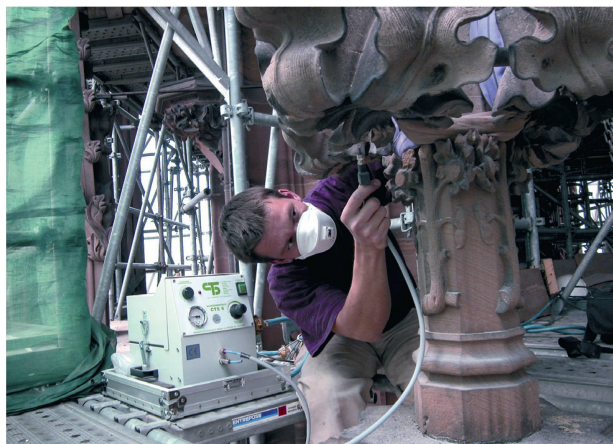
3 Travaux de conservation sur la flèche de la cathédrale

différentes fonctions du monument : activité culturelle, activité touristique, intérêt architectural et archéologique.