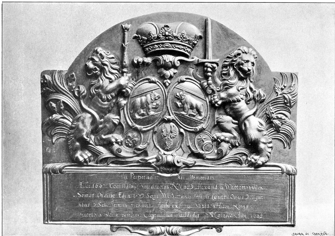
Bronzene Wappentafel am Münsterturm zur Erinnerung an die Renovation des nördlichen Treppentürmchens, 1697/98.