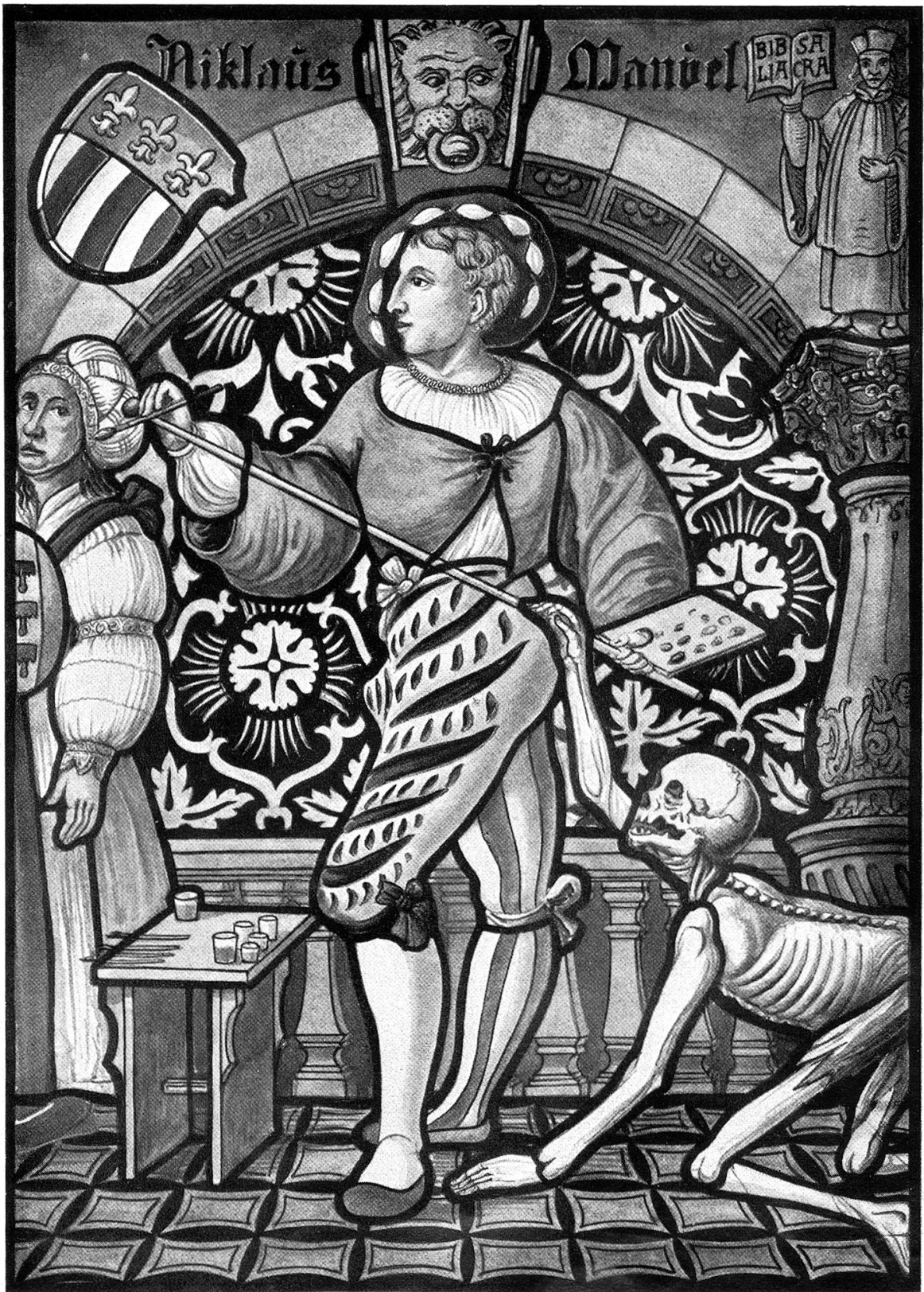
Aus Niklaus Manuels Totentanz. (Bild des Malers.)