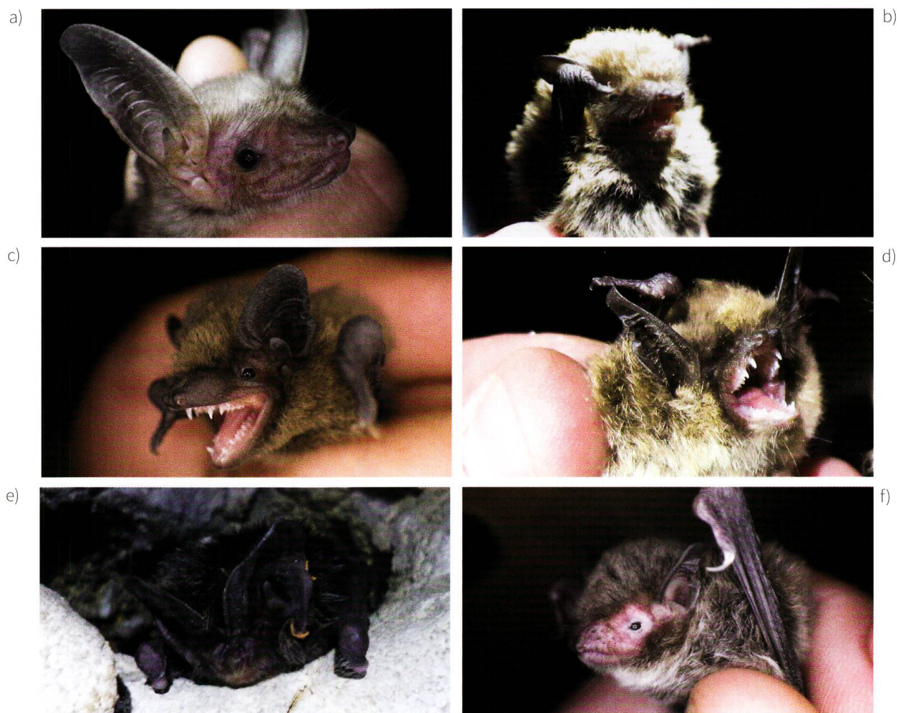
Figure 2. Espèces capturées dans le Bois de Chênes entre mai 2015 et août 2017. a. Grand murin ( Myotis myotis ). b. Pipistrelle commune ( Pipistrellus pipistrellus ). c. Pipistrelle pygmée ( Pipistrellus pygmaeus ). d. Murin à moustache ( Myotis mystacinus ). e. Barbastelle ( Barbastella barbastellus ). f. Murin de Daubenton ( Myotis daubentonii ).

La pipistrelle commune ( Pipistrellus pipistrellus ) (figure 2b) est quant à elle plutôt citadine. Cependant, c'est la chauve-souris la plus répandue en Suisse (GILLÉRON et al. 2015). Ce n'est donc pas surprenant d'avoir rencontré 8 individus de cette espèce dans le massif forestier. Elle chasse volontiers à proximité des lampadaires en milieu urbain mais s'adapte très bien au milieu forestier. Considérée comme sédentaire et non cavernicole, la pipistrelle commune peut s'accommoder d'un même gîte tout au long de l'année (changeant éventuellement de cavité au sein d'un même arbre).