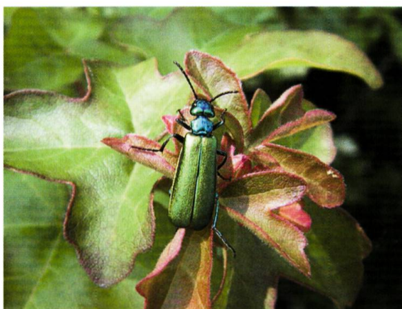
Figure 2. Lytta vesicatoria (Linnaeus, 1758), observée en lisière entre la Ferme et le Pré du Verger (zone 12) du Bois de Chênes (VD) le 6.06.2015.