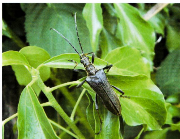
Figure 3. Stenocorus meridianus (Linnaeus, 1758), observé dans le Pré du Verger (zone 13a) du Bois de Chênes (VD) le 6.06.2015.