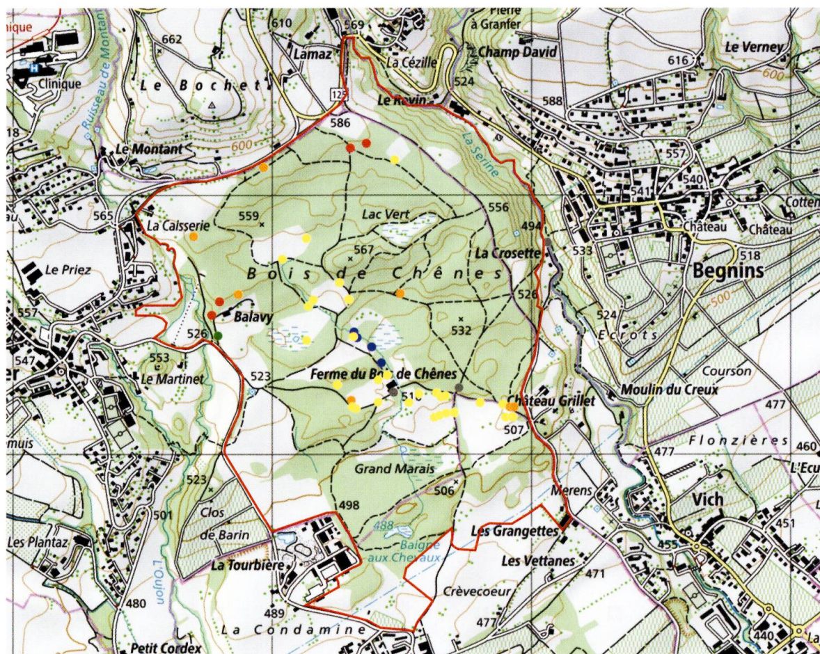
Figure 1. Carte des stations de lichens relevés au Bois de Chênes, avec l'indication du type de milieu. Points rouges: hêtraie; points oranges: chênaie à charme; points jaunes: lisière ou arbre isolé dans un milieu ouvert; points bleus: milieux humides; points verts: allée de pins; points gris: substrats rocheux. Le périmètre d'étude figure en rouge. Reproduit avec l'autorisation de swisstopo (BA18107).

Tableau 1. Liste des espèces de lichens relevées au Bois de Chênes, avec mention de la catégorie de liste rouge. LR CH - catégories au niveau national; LR Plateau - catégories au niveau du Plateau, avec les catégories suivantes: EN (en danger), VU (vulnérable), NT (quasi menacé), LC (préoccupation mineure) (SCHEIDEGGER & CLERC, 2002). Prio - espèces prioritaires au niveau national selon l'OFEV (2011) avec les catégories suivantes: 3 (priorité moyenne), 4 (priorité faible). Espèces considérées d'intérêt pour le canton de Vaud: IR - intérêt régional, ISR - intérêt supérieur régional (REC-VD, 2012), RPF - Espèces considérées comme rares ou menacées dans l'annexe du règlement cantonal concernant la protection de la flore du 2 mars 2005 (RPF). Vieux arbres - espèces prioritaires liées aux vieux arbres, selon SCHEIDEGGER & STOFER (2009). Nouveau VD: espèces mentionnées pour la première fois dans le canton de Vaud, en référence avec le Catalogue des lichens de Suisse (CLERC & TRUONG, 2012).