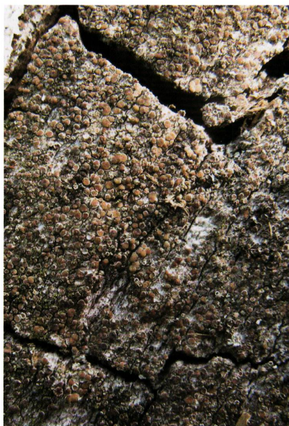
Figure 15. Calicium glaucellum , une espèce du groupe des Caliciales caractérisées par leur fructifications ressemblant à de petits clous et colonisant le bois mort à l'abri de l'influence directe de la pluie.