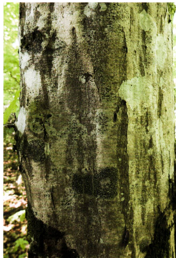
Figure 5. Ecorce de charme avec quelques espèces du Graphidion scriptae , notamment Arthonia atra au centre, en bas (photo: Mathias Vust).

l'écorce du hêtre (BARKMAN 1958). L'indice d'eutrophisation (N) moyen de 2,6 correspond à une situation très peu influencée par l'eutrophisation, ce qui est attendu de stations de pleine forêt, éloignées des surfaces engraisées.