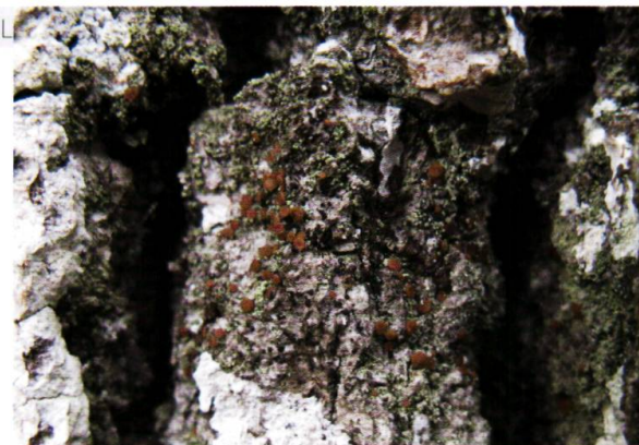
Figure 3. Bacidia rubella , espèce caractéristique de l'alliance de Agonimion octosporae rassemblant les espèces crustacées neutrophiles sur écorce rugueuse et ombragée.