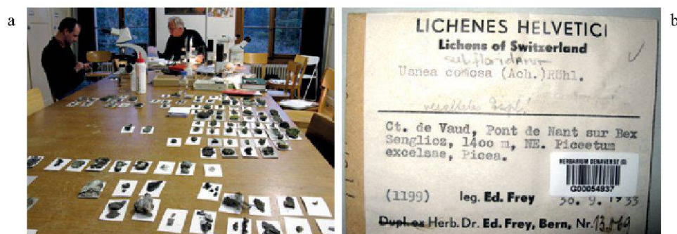
Figure 2.— a. Identification des échantillons récoltés lors des Journées de la biodiversité au Vallon de Nant (Conservatoire et Jardin botaniques de la Ville de Genève, novembre 2008). b. Echantillons du Vallon de Nant trouvés dans la collection d'Eduard Frey, qui fut l'un des meilleurs connaisseurs des lichens alpins, collection actuellement conservée dans l'herbier des Conservatoire et Jardin botaniques de la Ville de Genève. (Photos: C. Truong).