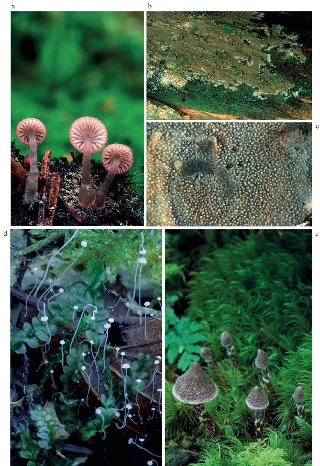
Figure 2.—Quelques espèces de champignons du Vallon de Nant. a. Mycena rubromarginata ; b. Coniophora paleaceus ; c. Scopuloides rimosa ; d. Mycena capillaris ; e. Cortinarius flexipes .