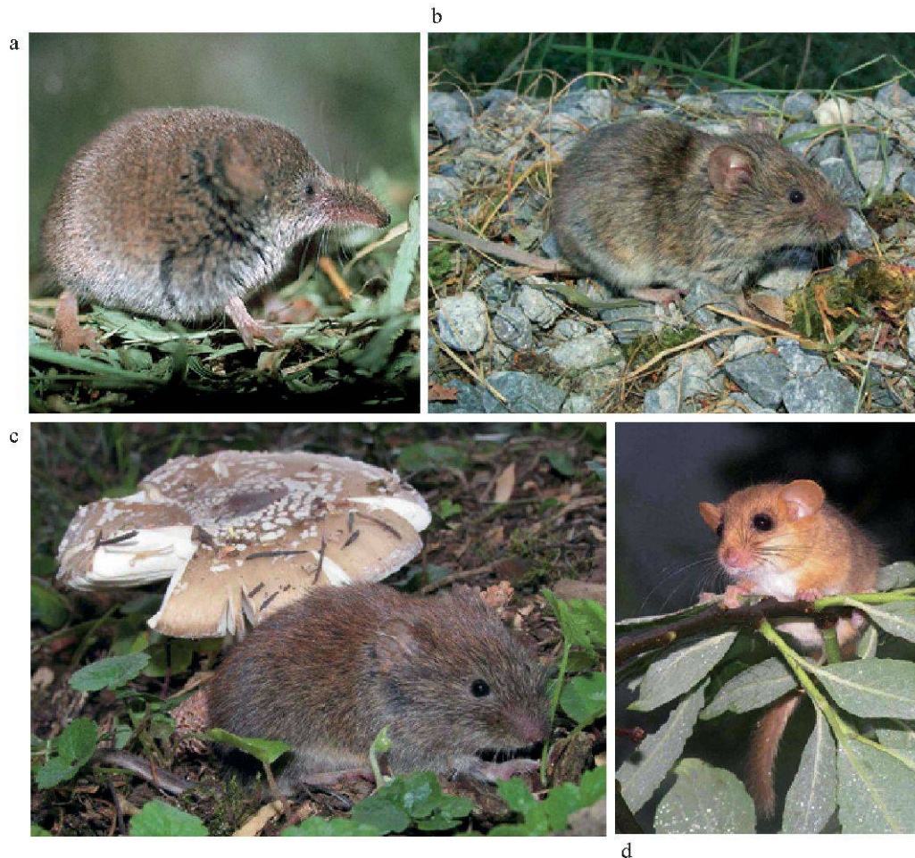
Figure 2.—Quelques espèces de micromammifères terrestres du Vallon de Nant.

a. Sans que l'on sache vraiment pourquoi, la musaraigne carrelet ( S. araneus ), un discret occupant du Vallon de Nant, est remplacée à quelques kilomètres de là, de l'autre côté des montagnes, par sa consœur vicariante, ici la musaraigne du Valais ( S. antinorii ) (Simplon, 2003).;