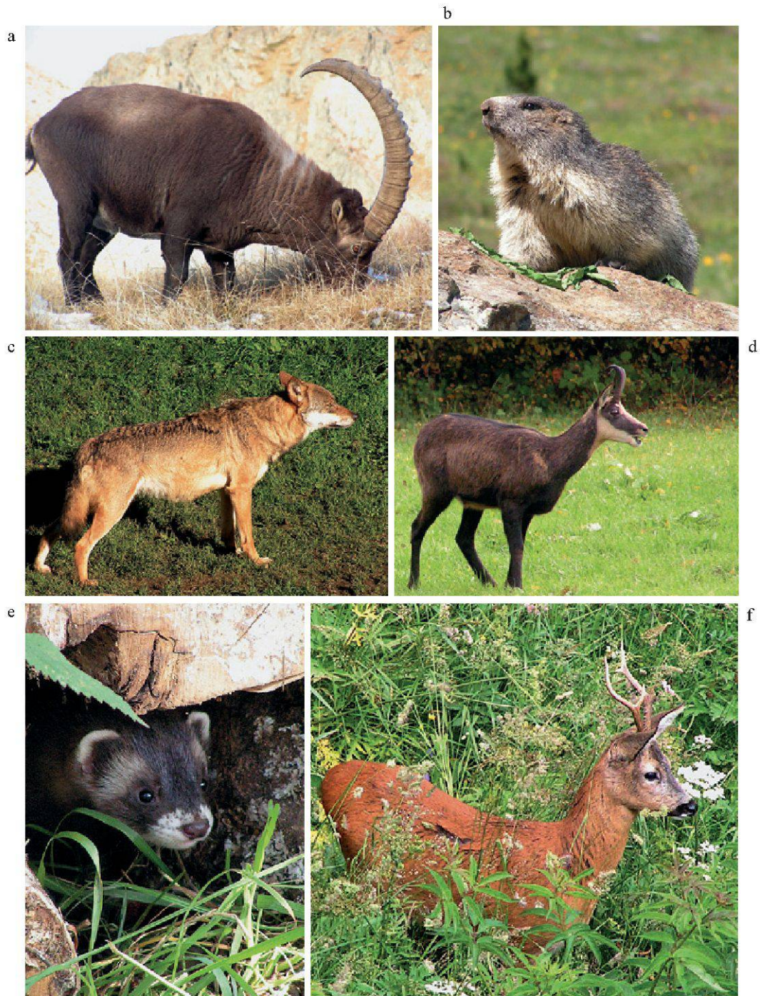
Figure 1.—Quelques espèces de mammifères terrestres du Vallon de Nant: a. Bouquetin des Alpes ( Capra ibex ); b. Marmotte des Alpes ( Marmota marmota ); c. Loup ( Canis lupus ); d. Chamois ( Rupicapra rupicapra ); e. Putois ( Mustela putorius ); f. Chevreuil ( Capreolus capreolus ). (Photos: P. Marchesi).