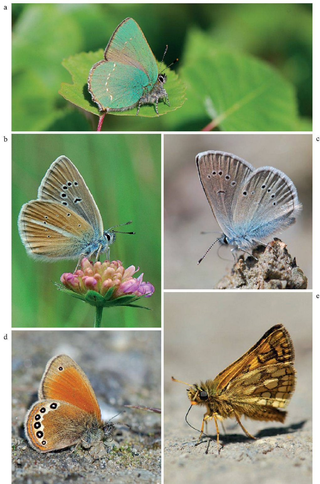
Figure 8.—Autres espèces de papillon du Vallon de Nant: a. Calophrys rubi ; b. Polyommatus damon ; c. Polyommatus semiargus ; d. Coenonympha gardetta ; e. Carterocephalus paleomon . (Photos: Y. Chittaro).