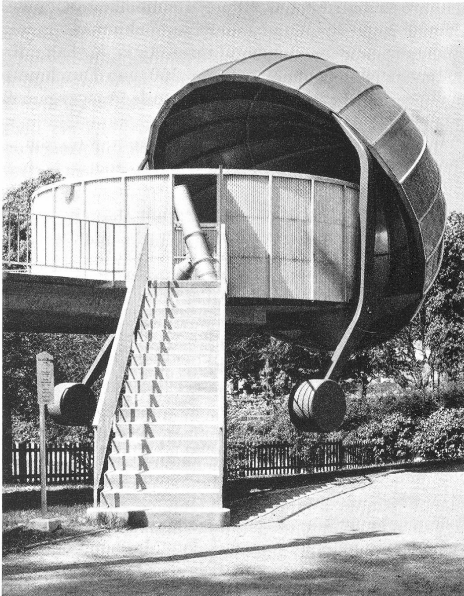
Teleskop-Raum der Schul- und Volkssternwarte Schaffhausen. Durchmesser 6,2 Meter. Schwenk-Kuppel halb abgekippt. Totalgewicht mit den beiden Gegengewichten 4 Tonnen. Freitragende Betontreppe.