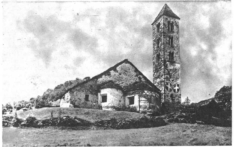
L'antichissima Chiesa di Negrentino, che fu parrocchiale di Prugiasco fino al 1700.

Storicamente e politicamente, per molto tempo, Prugiasco ebbe una sua fisionomia tutta particolare: fu «terra leventinese in Blenio». Esso era cioè unito, presumibil-