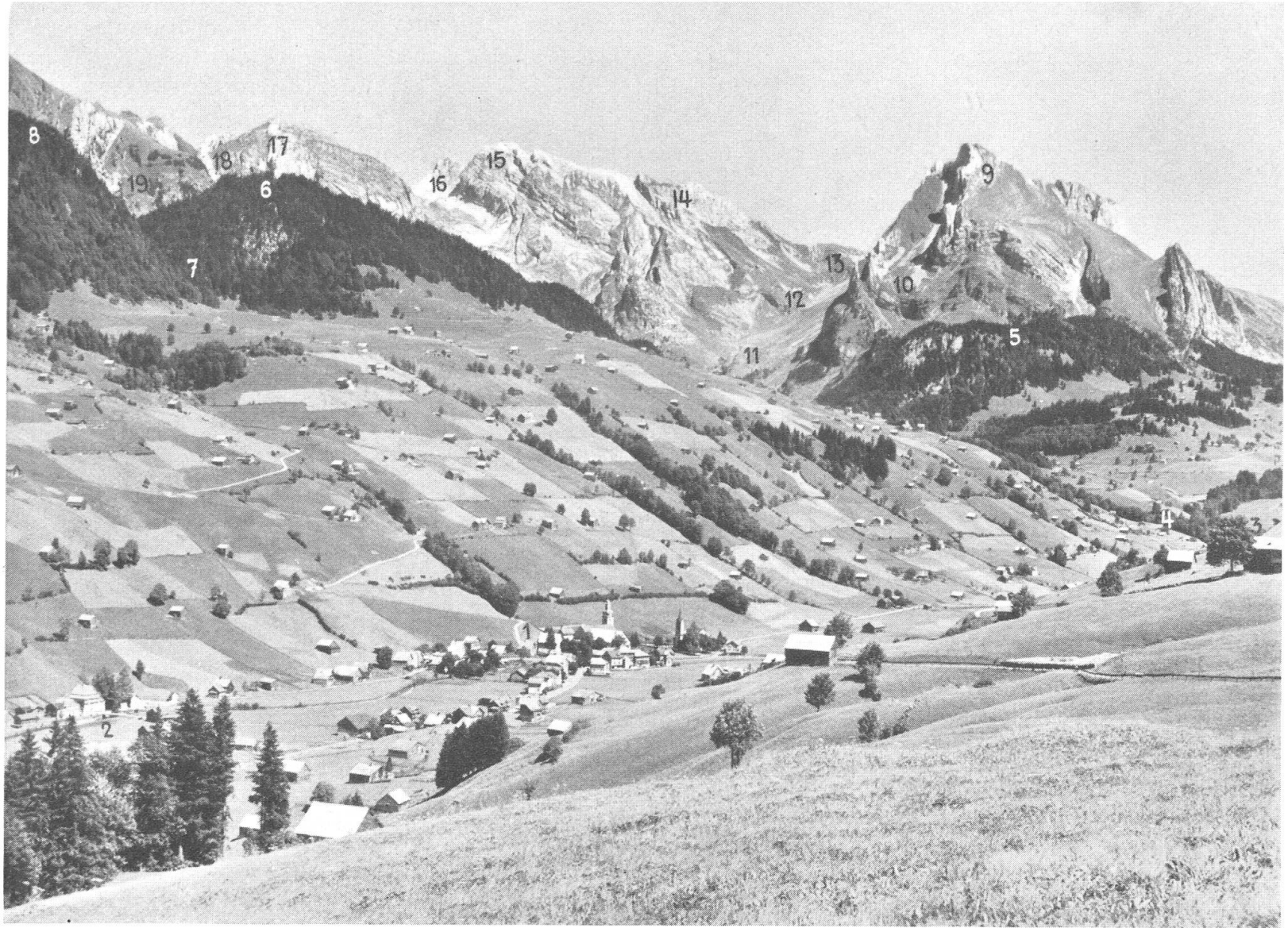
Alt St. Johann mit Wildhauser Schafberg und Säntis