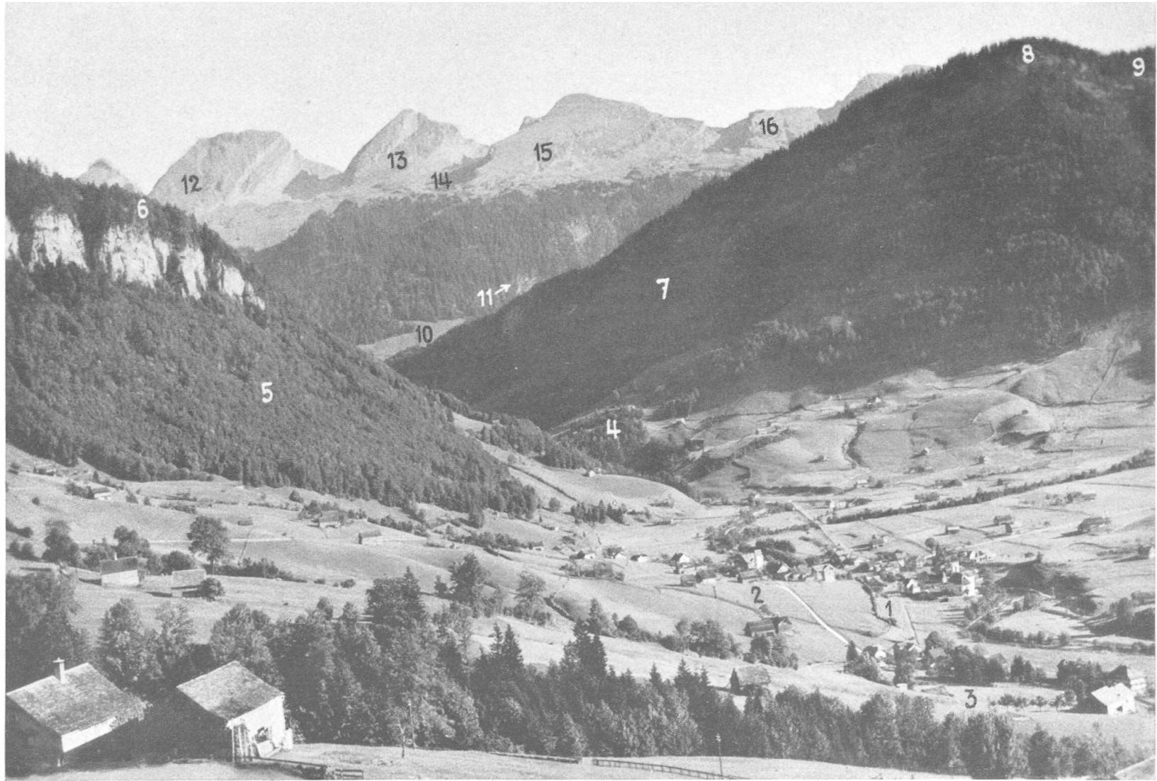
Stein mit Churfirften