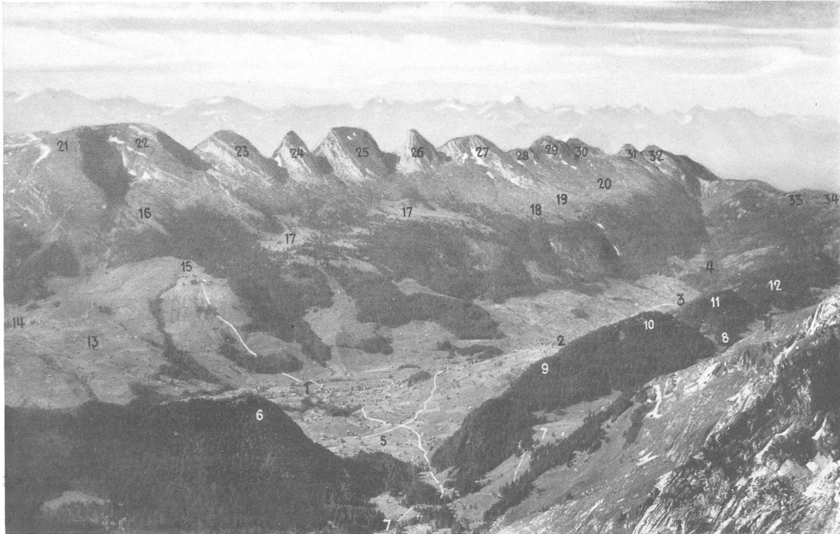
Unterwasser mit Churfirnen