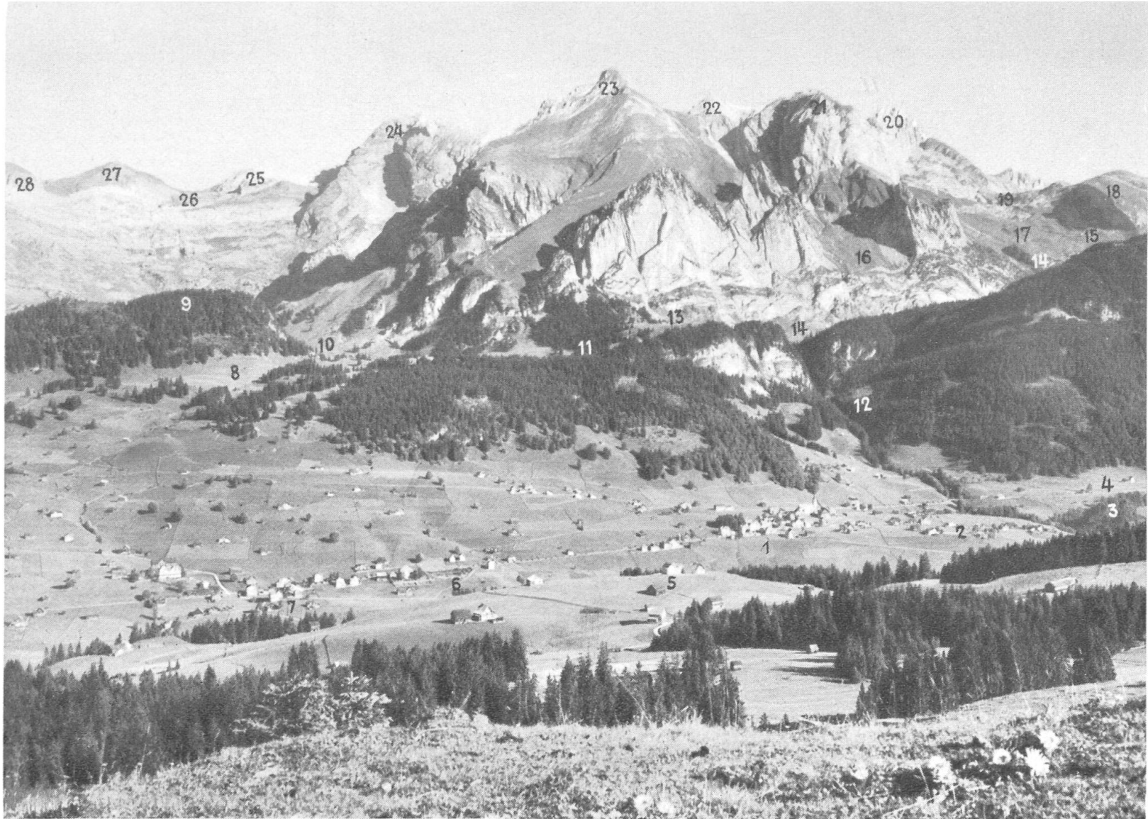
Wildhaus mit Schafberg und Säntis