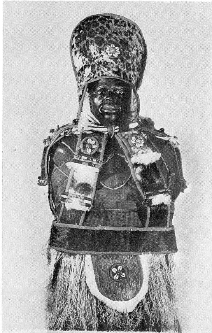
Poromaske, Sierra Leone (W.-Afrika). \frac{1}{11} nat. Gr.