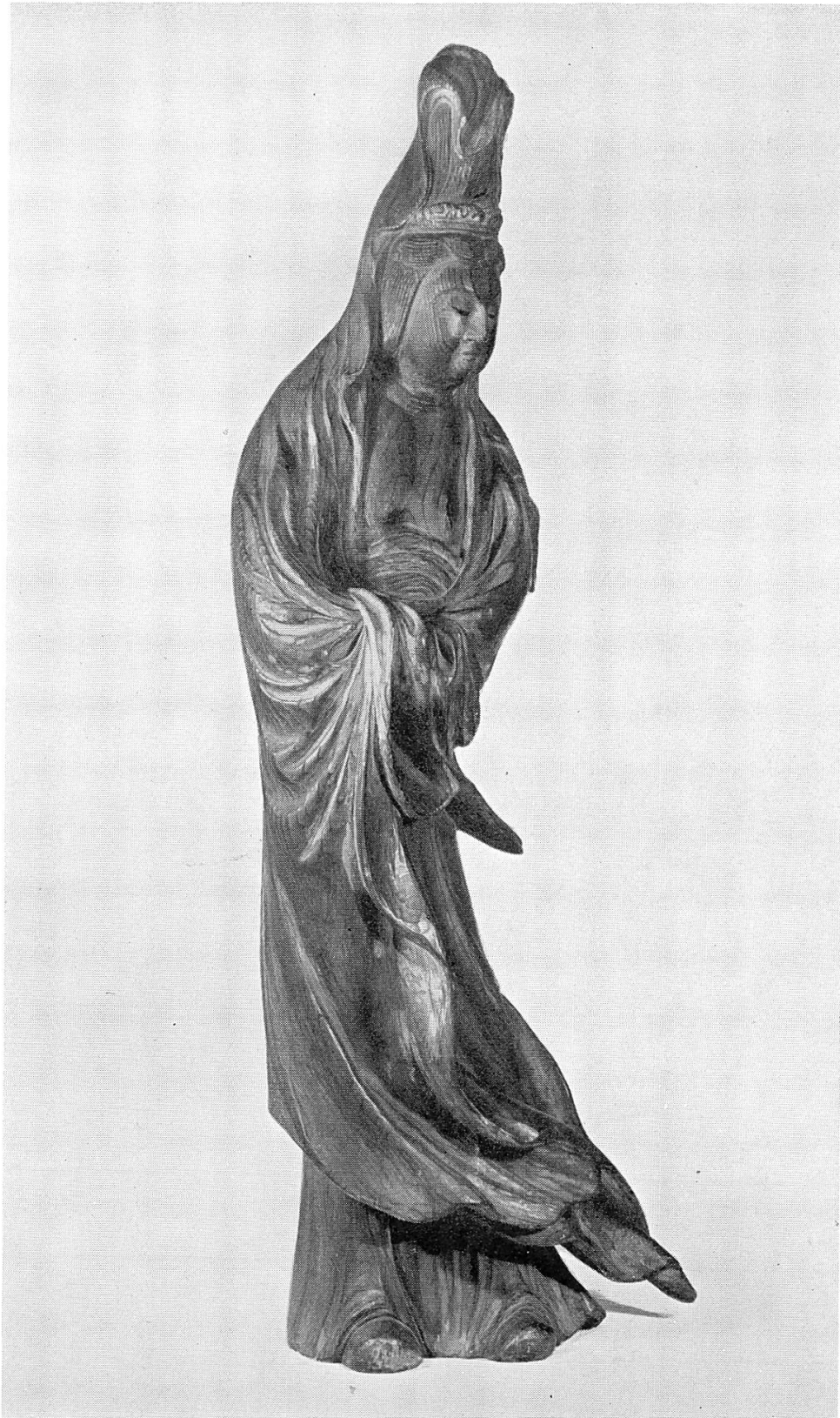
Kwannon, Japan. \frac{1}{6} nat. Gr.