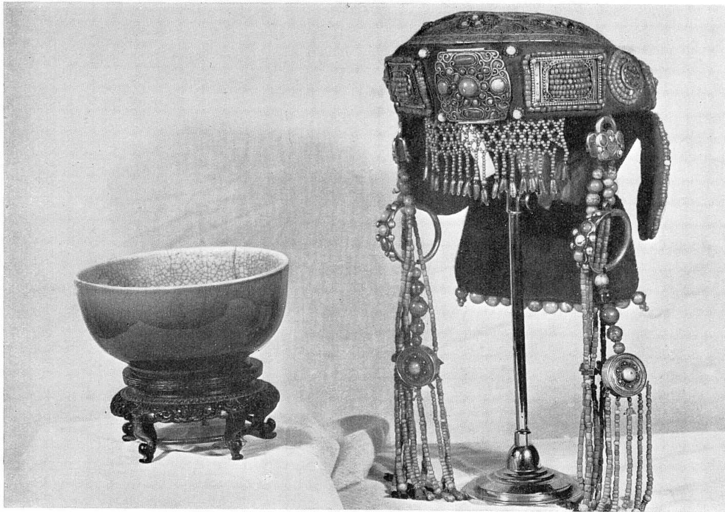
Chinesische Ochsenblutschale; mongolischer Kopfputz; \frac{1}{4} nat. Gr.