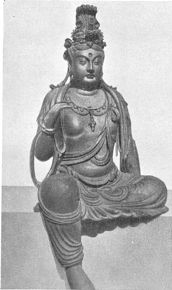
China: Bodhisattva (Maitreya) aus der Sung-Jüanzeit, 12./13. Jahrh. (Höhe: 1,50 m)

Unseren Sammlungen fehlte bis anhin ein die chinesische Familienfrömmigkeit belegender Haustempel. In der Berichtszeit liessen sich nun zwei derselben erhältlich machen, die in ihrer Erscheinung ganz voneinander verschieden sind. Der eine dieser Haustempel aus Tonking besitzt ein schwarzlackiertes Gehäuse mit reichgeschnitztem und vergoldetem Aufsatz und Seitenflügeln, thronende Gottheit, Gefäss mit Weihrauchstengeln. Der andere der Tempel aus dem Umgebiete Schanghais besitzt die chinesische Tempelform mit geschwungenem Dach, enthält Hauptgottheit und zwei Nebengottheiten. Aus gleicher Gegend stammt eine aus über 50 Einzelstücken zusammengefügte, überlegt verzapfte Tempelaterne mit reichem Schnitzwerk. Erworben werden konnte sodann eine chinesische Ahnentafel, rot, beschriftet. Nach chinesischer Vorstellung löst sich die Seele des Verstorbenen in drei Einzelseelen auf, deren eine im Grabe wohnt, deren zweite in die Unterwelt geht, bis sie die Sünden abgebusst hat, und deren dritte in der Ahnentafel verborgen und wirksam bleibt, wo sie Wünsche und Bedürfnisse hat, gleich wie der Lebende. Werden diese nicht durch Opfer befriedigt, so nehmen