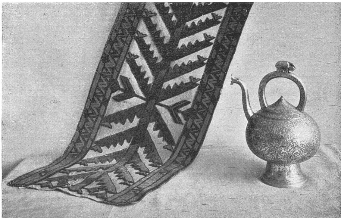
Abbildung 1: Bocharaband und zentralasiatische, fein ziselierte Broncekanne.

Aus dem malayischen Archipel darf ein ansehnlicher Zuwachs registriert werden: