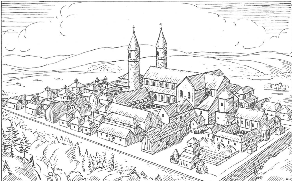
2. Das Kloster St. Gallen nach dem Plane von Abt Gozbert vom Jahre 820.

1. Platz der Galluszelle. 2. Steinach. 3. Mühltobel. 4. Freudenberg. 5. Berneckhöhe. 6. Nestsattel. 7. Irabach. 8. Kugelmoos. 9. Irahügel. 10. Hopsgermoos. 11. Rosenberg.