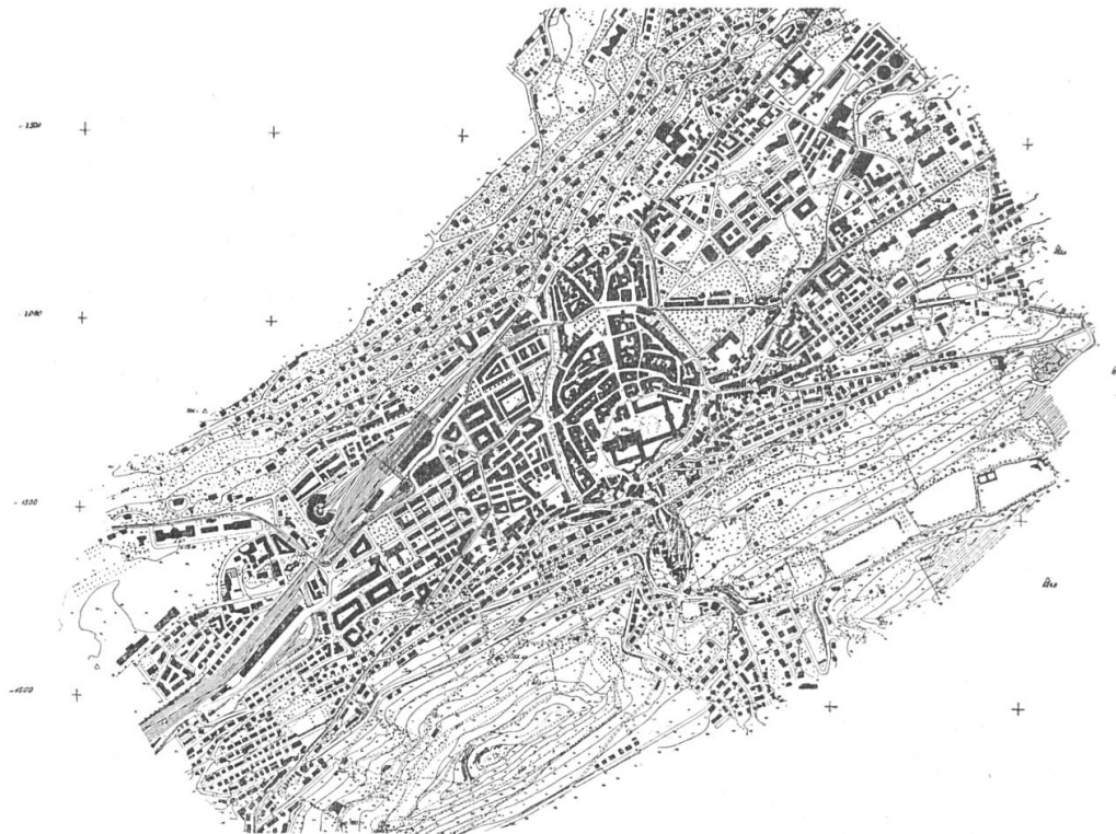
Fig. 1. Copie des Originalblattes Nr. 3, ungefähr dreimal verkleinert.

Von allen 3 Gebieten zusammen, also mit 3963 ha Flächeninhalt, waren bei der Inangriffnahme der Arbeiten für den Uebersichtsplan genaue Kurvenaufnahmen vorhanden, mit Ausnahme des Grundeigen-