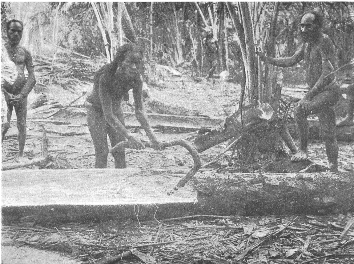
No. 1. Herausschlagen des Sagomarkes aus dem gefällten Palmenstamm.

jedoch weitaus häufiger. Wie wir bereits angedeutet haben, scheint sehr oft auch die Mädchenadoption mit solchen praktischen Gründen zusammenzuhängen. An zweiter Stelle wäre als Nahrungsmittel die Kokosnuss zu nennen. Für den Anbau von Kokospalmen kommen aber nur die sandigen Küstenwalle in Betracht. Deshalb sind denn auch nachweisbar die allermeisten Siedelungen auf den sandigen Partien gelegen, erstens, eben wegen dem Anbau von Kokospalmen und zweitens, weil