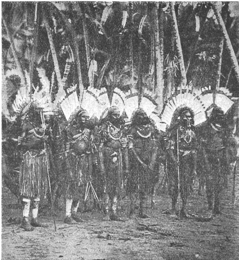
No. 4. Männer, die den Festgesang singen und die Trommeln schlagen.

mit dem Schmucke der Dema-Figuranten. Beim Einerschreiten schlägt er eine grosse Trommel. Mit stampfenden Schritten betritt er nach dem Takt der Trommel den Festplatz. Die Fläche, die er trägt, bedeutet nicht etwa, wie man leicht annehmen möchte, die Sonnen- oder Mondscheibe. Sie spielt vielmehr, wie auch die andern Dema, eine Hauptrolle bei den Geheimkulten. Sie dient nämlich unter den Eingeweihten als Verständigungsmittel und gibt Kunde, dass die