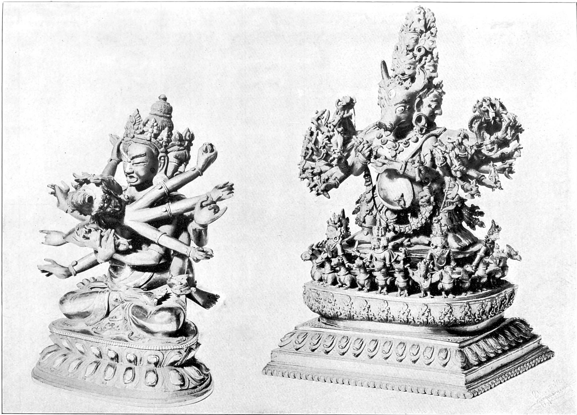
2 Yi-dam, tibetanische Schutzgottheiten ( \frac{3}{4} natürlicher Grösse).