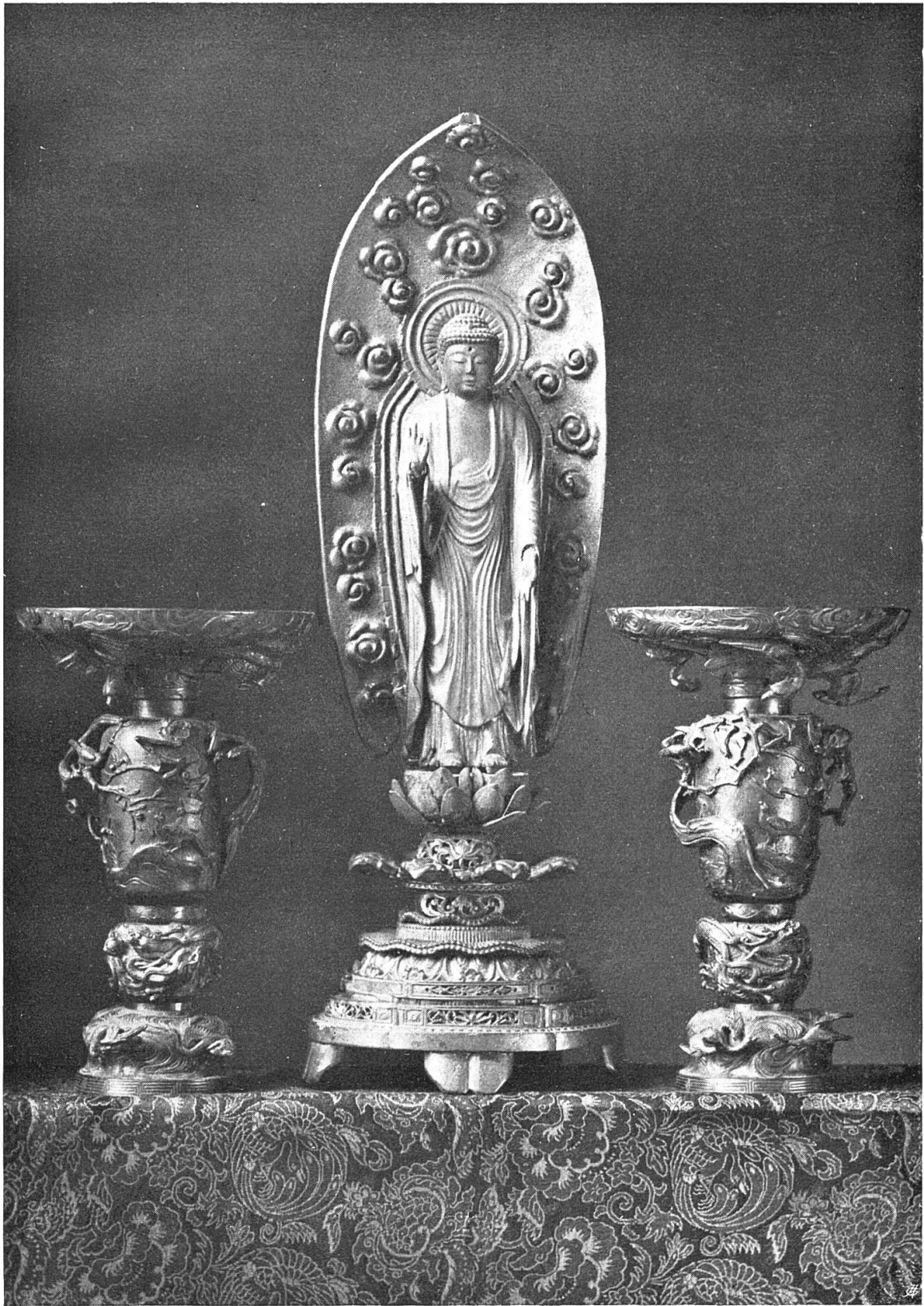
Bronzevasen — Japan. Buddha — China.