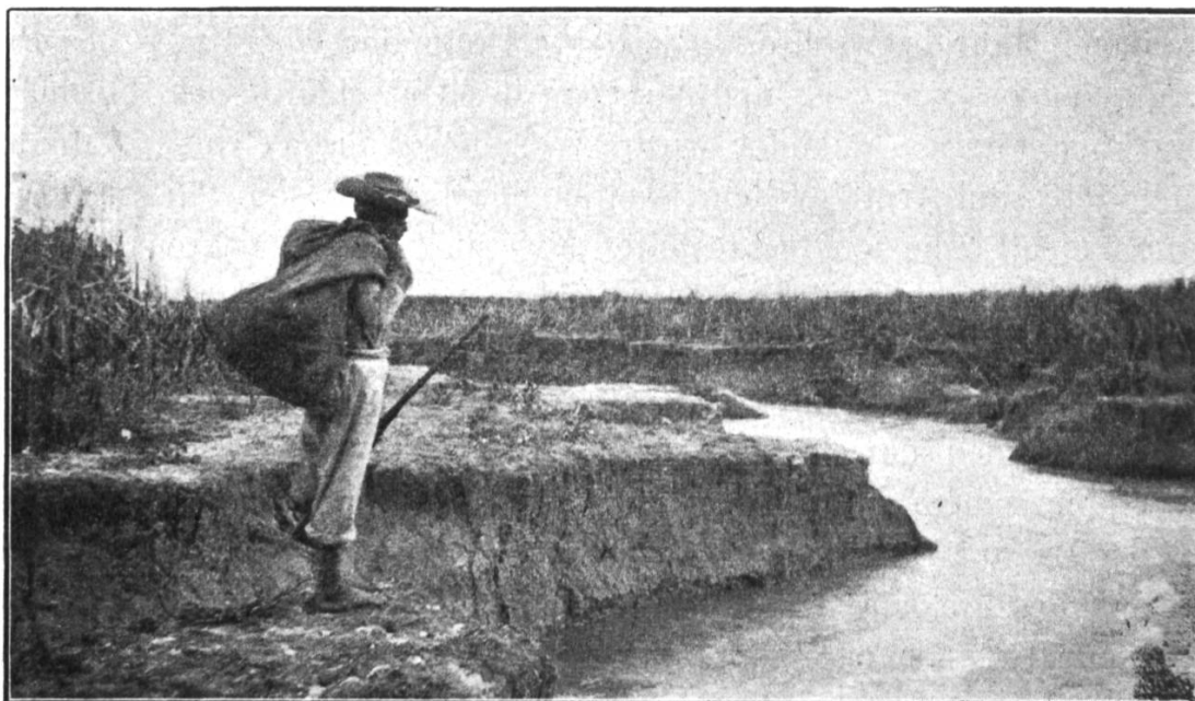
Ursprung des Rio Confuso.

Das Flussbett des Pilcomayo geht noch einige 20 km ohne Unterbrechung bis zur Laguna Chaik-Sataindi (indianisch für: viele Palmen) weiter, an welchem Punkte sich der Estero in zwei Arme teilt. Hier fliesst der Pilcomayo innerhalb des engen südlichen Armes des Estero, welcher eine Breite von nur 1500 m hat und auf beiden Seiten von Algarrobo-Wald begrenzt wird. Etwa 20 km nachher mündet dieser kleine Estero in den grossen Estero Patiño, der übrigens niemals ein See gewesen sein kann, wie dies bisher angenommen wurde. Innerhalb dieser ganzen Strecke und weiteren 10 km, in denen die Wasser des Pilcomayo im Estero Patiño fliessen,