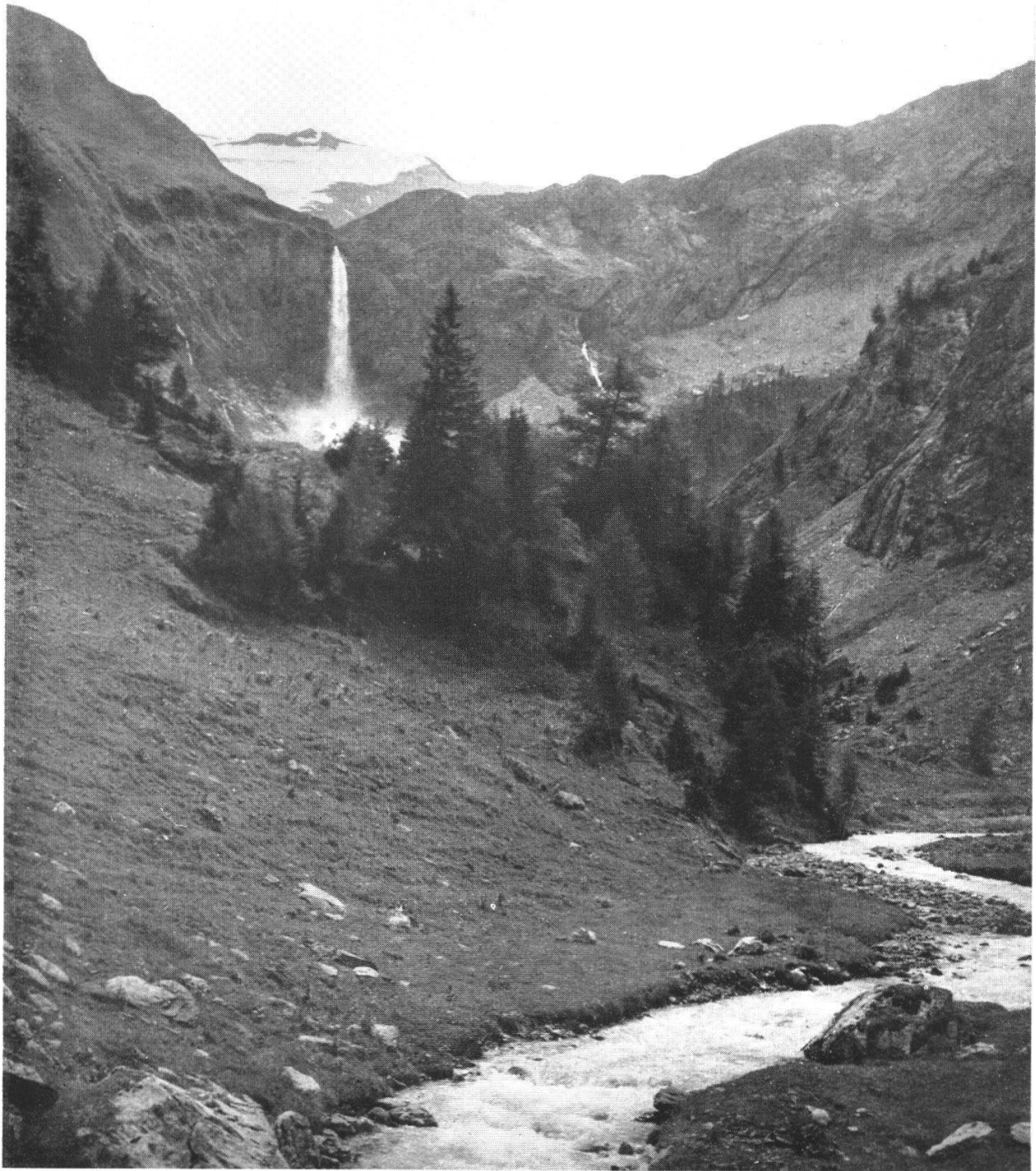
III Der oberste Teil des Lauenentales mit dem großartigen Felsabbruch und dem darüber sich hinunterstürzenden Geltenschuß. Siehe Seiten 82 ff.