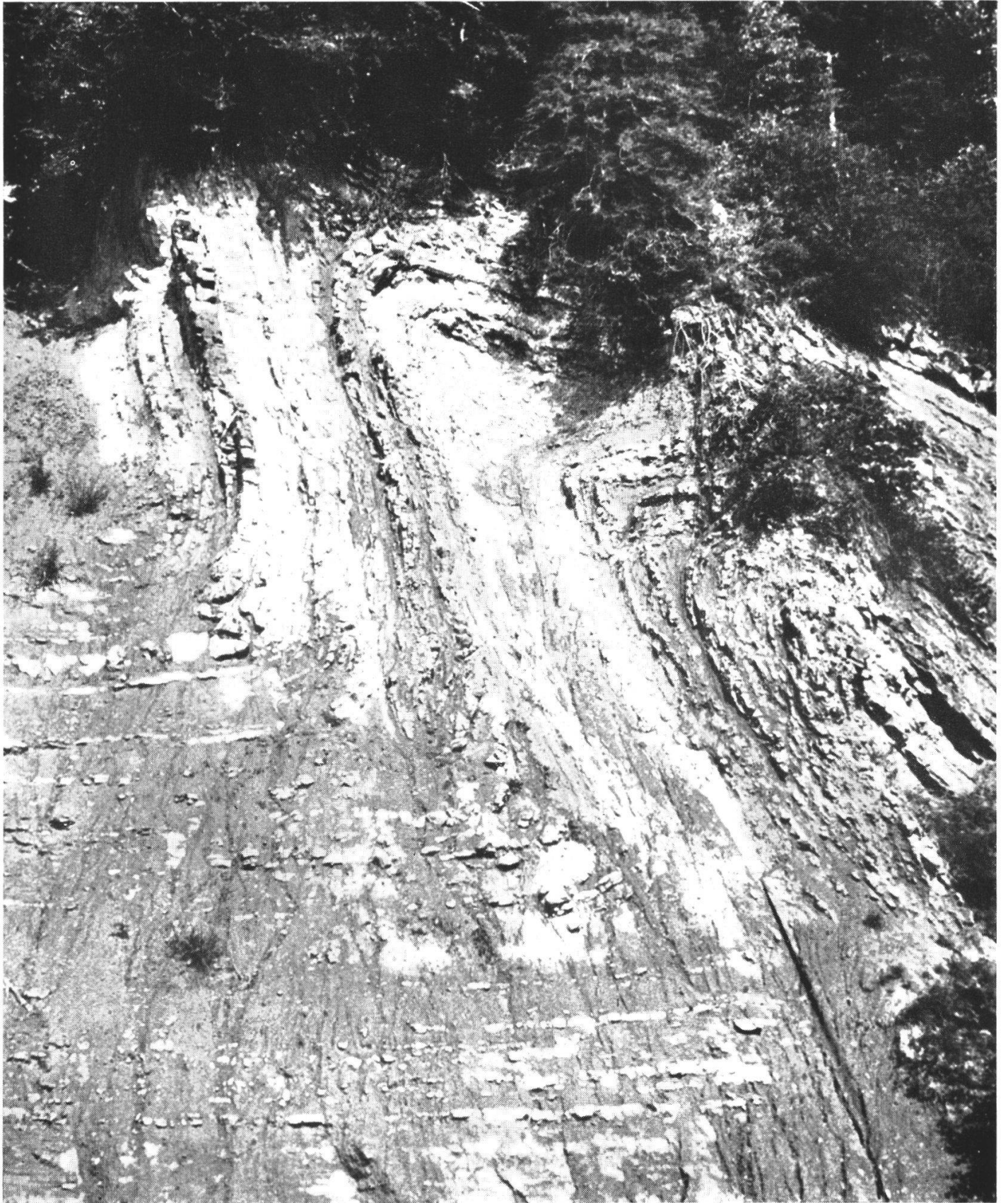
II Molassefaltungen im Fallvorsassli, Guggisberg. Siehe Seite 81 ff.