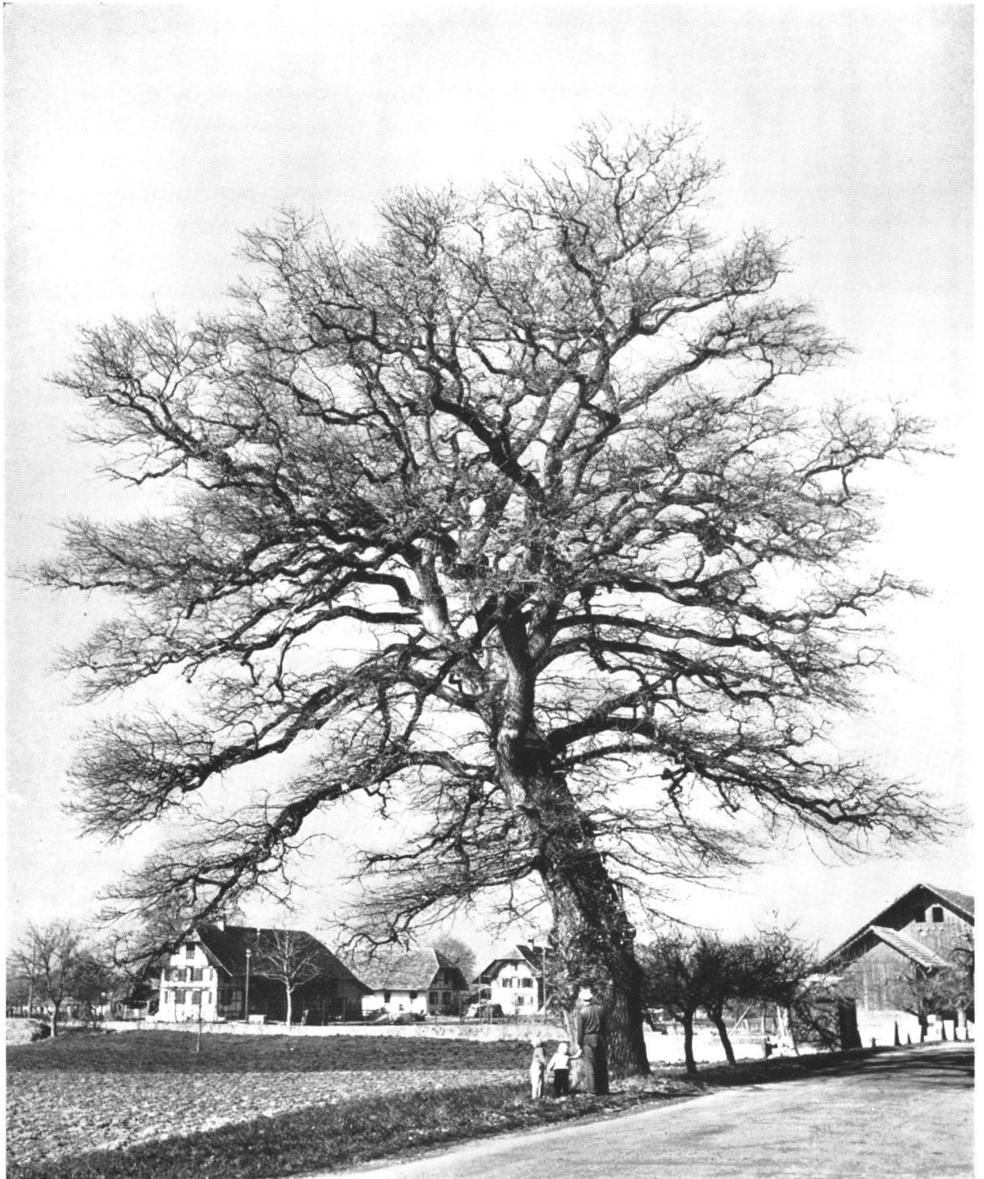
I Scheurer-Eiche in Gampelen. Siehe Seite 86.