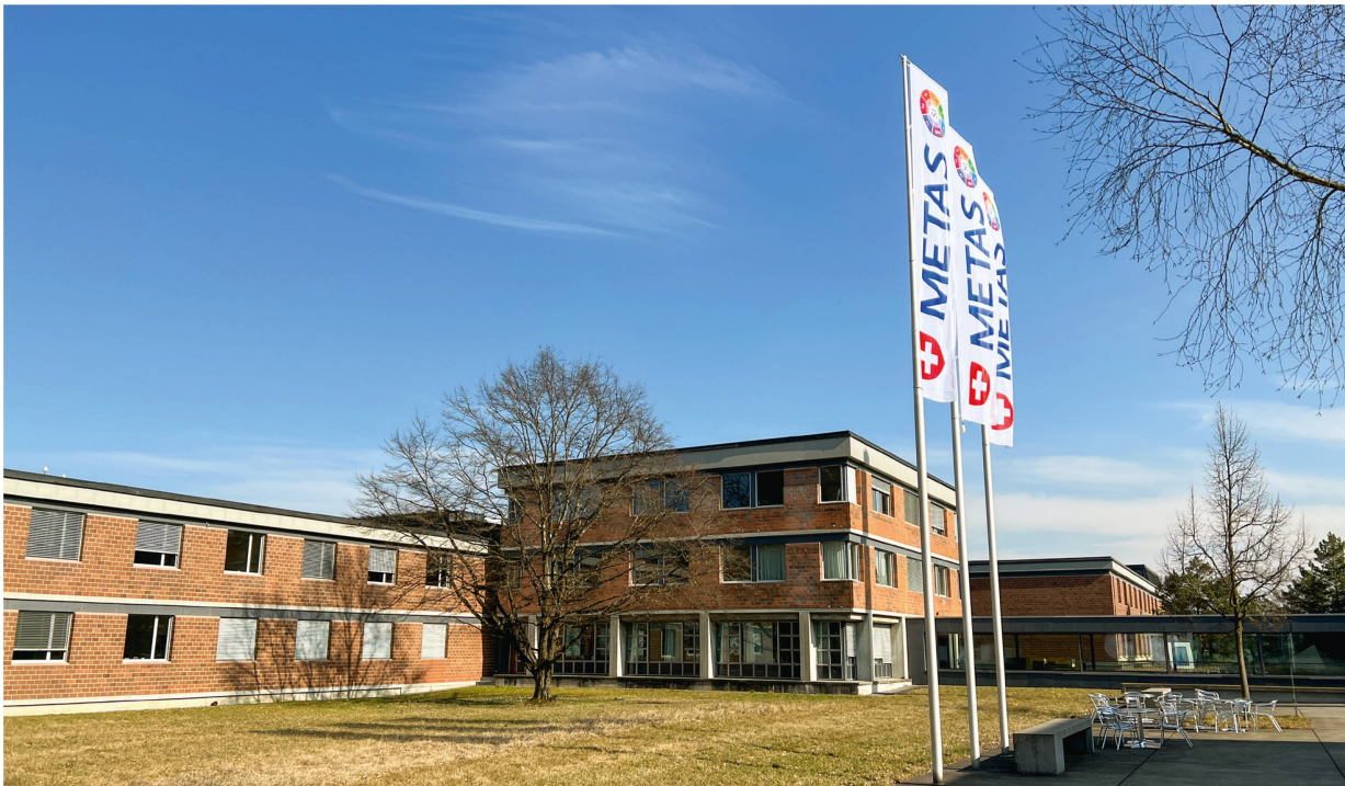
Abb. 4 und 5: Das METAS in Wabern ist der Ort, an dem die Schweiz am genauesten ist. Es ist gewissermassen der Hüter der Masseinheiten für die Schweiz.