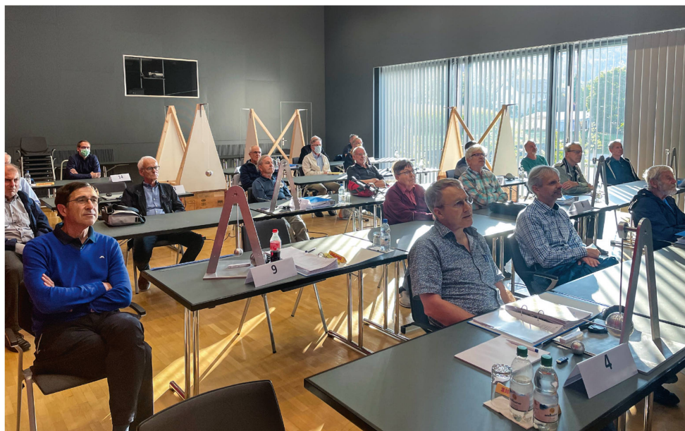
Abb. 1: 27 Teilnehmende verfolgen die einführende Präsentation.

Nach einem einführenden Vortrag ( Abb. 1 ) führte Jürg Niederhauser die Teilnehmenden zuerst durch eine Sammlung historischer Präzisionsmessinstrumente. In dem kleinen Museum, das auch für die Öffentlichkeit zugänglich ist, wird die Entwicklung des Messwesens und der wissenschaftlichen Metrologie anschaulich dargestellt ( Abb. 2 ).