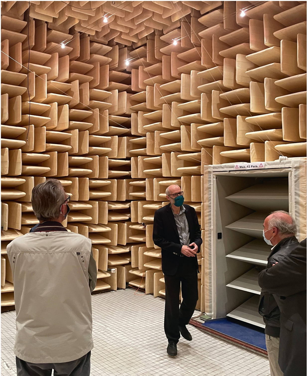
Abb. 3: Das Akustiklabor ist mit schallabsorbierenden Wänden ausgerüstet, um Kalibrierungen und Eichungen nicht durch Schallreflexionen zu beeinflussen.