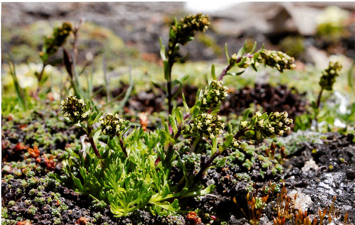
Abbildung 9: Schnee-Edelraute ( Artemisia nivalis )

Weiter oben am Hang, der mehr von Bündner Schiefer geprägt ist, wandern wir dann durch Blaugrashalden, wo wir noch spät blühende Edelweisse entdecken. Auf über 2700 m.ü. M. treffen wir noch junge Lärchen an, was eventuell dafür spricht, dass sich die Baumgrenze nach oben verschiebt. Kurz vor der Bergstation der Gondelbahn dann die Zone mit Alpiner Kalkschieferflur ( Drabion hoppeanae ), in der sich auch die Schnee-Edelraute ( Artemisia nivalis ) befindet. Auffallend bei ihr sind die normalerweise ganz kahlen Pflanzen mit dem häufig rot gefärbten Stängel. Wir entdecken allerdings auch einige leicht behaarte Exemplare, die vom restlichen Habitus her aber eher der Schnee-Edelraute ( Artemisia nivalis ) zuzurechnen sind als einer anderen Artemisia-Art. Interessant ist, dass diese Art die Eiszeit vermutlich im Gebiet von Zermatt überdauert hat, sich aber seither nicht in weitere Gebiete verbreiten konnte und deshalb sehr selten geblieben ist.