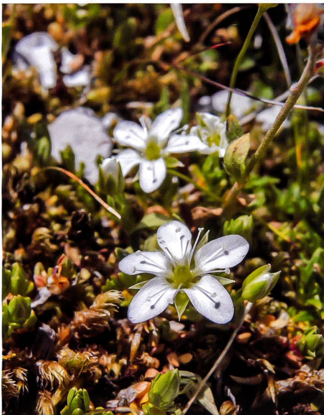
Abbildung 5: Berner Sandkraut ( Arenaria bernensis )

Auf dem Gipfel der Bürglen angekommen, machen wir uns auf die Suche nach Arenaria bernensis und finden sie auf der Nordseite, einige Meter unterhalb des Gipfels, an ihrem bevorzugten Standort zwischen Moospolstern. Die Art wurde von Claude Favarger ursprünglich als Unterart zu Arenaria multicaulis beschrieben. 2013 haben dann Forscher der Universität Freiburg das Chloroplasten-Genom verglichen und ist auch auf abweichende Chromosomenzahlen ges-