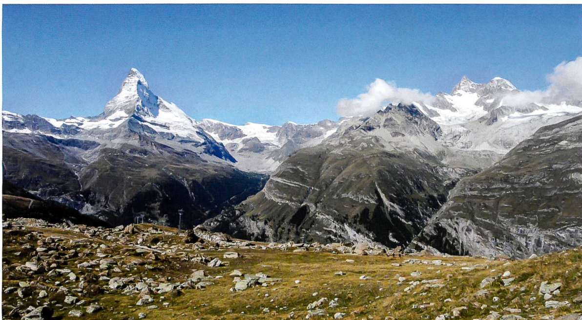
Abbildung 7: Blick vom Blauherd zum Matterhorn