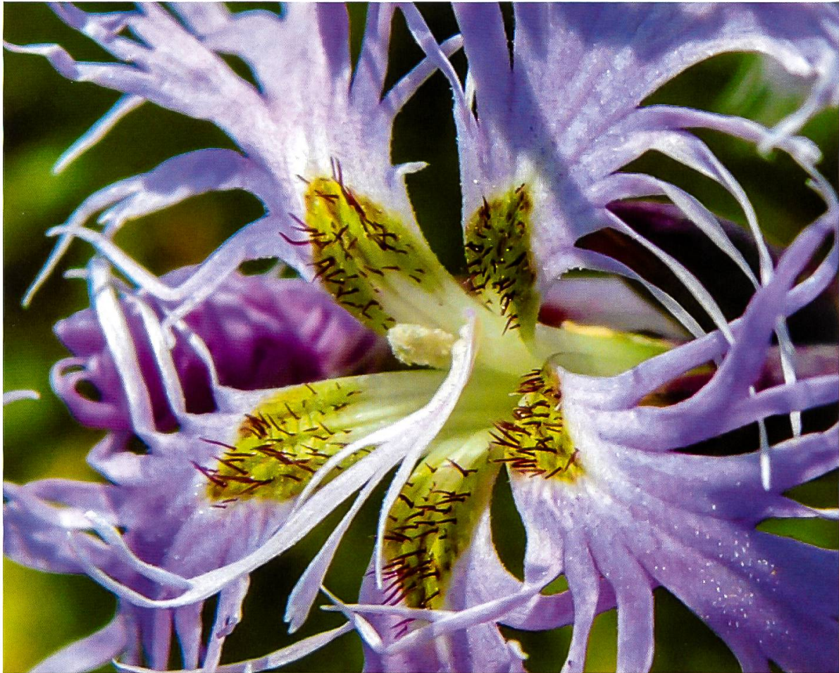
Abbildung 6: Prachtnelke ( Dianthus superbus )

Greiskraut, ganz am Ende der Blüte) oder Oxytropis halleri s.str. (Gewöhnlicher Haller-Spitzkiel, nur noch mit Früchten).