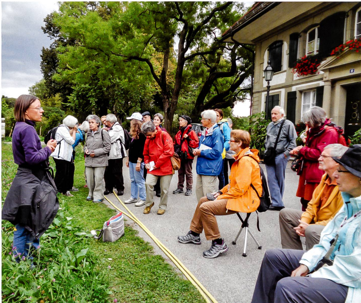
Abbildung 10: Exkursionsgruppe in der Elfenau

sensalbei) und Beatrice erläutert, dass Hummeln die einzigen Hautflügler sind, die mit Muskelvibration ihre Körpertemperatur erhöhen können. Mein Aha-Erlebnis: Ah, deshalb sind es Hummeln und nicht Bienen, die früh morgens und spät abends auf dem Balkon die Ipomoea (Prunkwinden) besuchen. Apropos Muskeln: Die Muskeln der grossen Vorderbeine der Krabbenspinnen sind zur Kontraktion gut – die Entspannung erfolgt aber durch Körperdruck von hinten. Apropos Spinnen: die produzieren offenbar vier verschiedene Fadentypen: Sicherheitsfaden (extrem stark und dehnbar), Faden zum Einspinnen der Coccons (unangenehm zum Fressen, also Schutz), sowie zwei Fadentypen für Netze (klebrig und nicht klebrig).