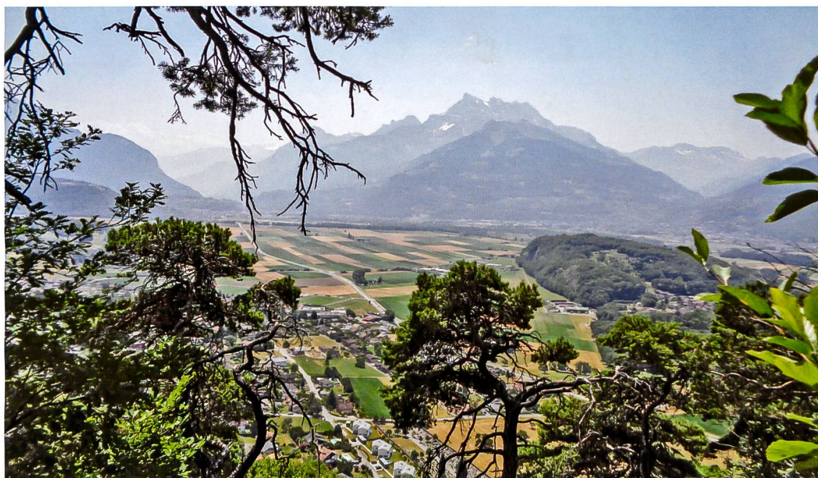
Abbildung 2: Sicht aus dem Bois de la Gleva.

Der Sommer 2015 war in vielerlei Hinsicht ausserordentlich. Die BBG hat er zu ausserordentlich seltenen und auf kleinen Raum beschränkte Arten gebracht. Unter dem die Titel «die Schöne» sollte dabei auch einem der vier echten Schweizer Endemiten, der Onosma helvetica (Schweizer Lotwurz) einen Besuch abgestattet werden. Ausserordentlich heiss war er auch, dieser Sommer 2015. Und vielleicht der heisseste Tag überhaupt war der 4. Juli. So heiss, dass viele der Exkursionsteilnehmenden frühzeitig «kalte Füsse» gekriegt haben und sich vorsorglich von der Exkursion abgemeldet haben. So war dann das Grüppchen wegen der Sommerhitze auf die Hälfte geschmolzen und nur 7 Teilnehmende fanden sich zur Exkursion in Aigle ein. Auch den Exkursionsleitenden war es für einen Aufstieg in den Bois de la Gleva an diesem Tag etwas zu heiss, und so wurden die ersten Höhenmeter kurzentschlossen mit der Bahn bewältigt.