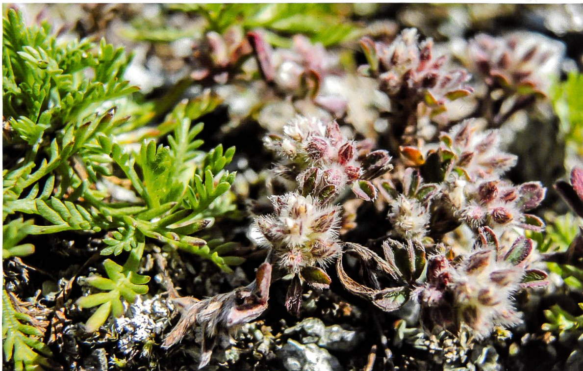
Abbildung 8: Steinklee mit Moschus-Schafgarbe ( Trifolium saxatile und Achillea moschata )

Geologisch ist Zermatt geprägt von sehr stark durchmischten Gesteinstypen, treffen doch kalkige Sedimente und Silikatgesteine aufeinander, was eine vielfältige Flora fördert. Typische Zermatter Raritäten sind neben der Schnee-Edelraute ( Artemisia nivalis ) der Schweizer Spitzkiel ( Oxytropis helvetica ), Hallers Greiskraut ( Senecio halleri ), Niedrige Rapunzel ( Phyteuma humile ) oder die Gefranste Segge ( Carex fimbriata ) um nur ein paar wenige aufzuzählen.