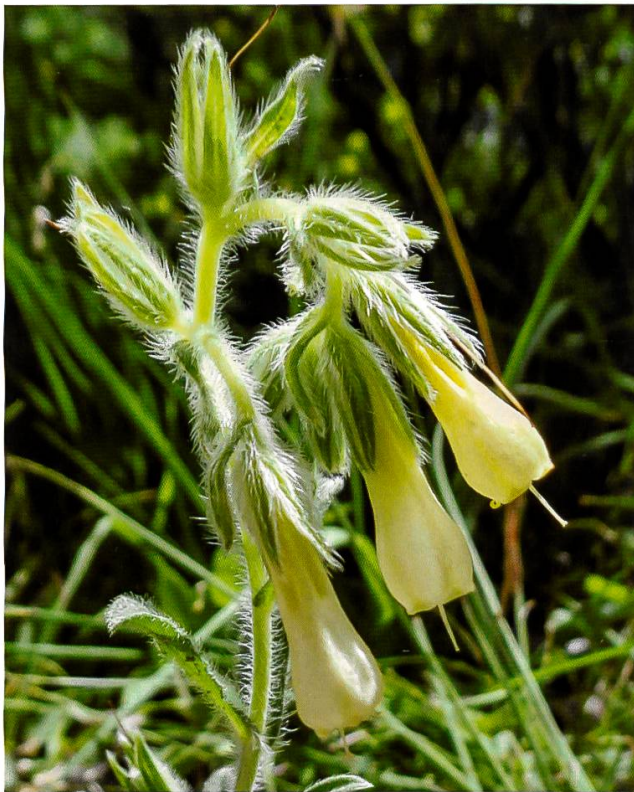
Abbildung 3: Blütenstand der Schweizer Lotwurz ( Onosma helvetica )