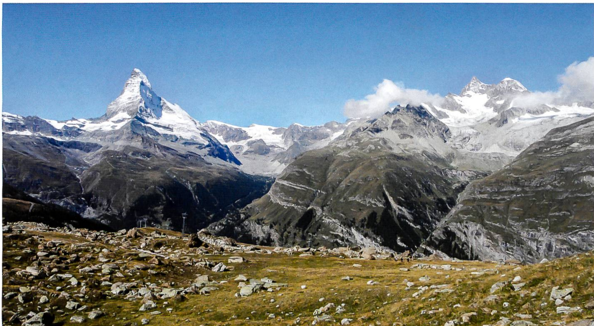
Abbildung 7: Blick vom Blauherd zum Matterhorn