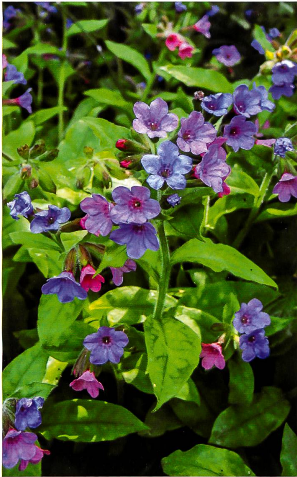
Abbildung 1: Schweizer Lungenkraut ( Pulmonaria helvetica )

muss nach der letzten Eiszeit durch komplizierte Hybridisierungsvorgänge und nachfolgende Stabilisierung der Chromosomenzahl entstanden sein. Die stattliche, bis 60 cm hohe Staude ist sowohl morphologisch (Borstensmuster der Blätter) als auch karyologisch (Chromosomenzahl) als eigenständige Art gut charakterisiert.